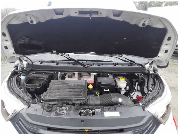
Abbildung 3: Sonstiges