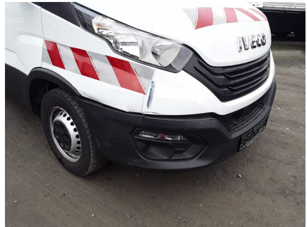
Beschädigung 6: Stossfänger vorn: Stossfänger vorn - verkratzt / verschürft - lackieren