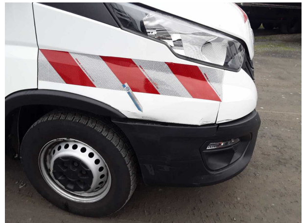
Beschädigung 8: Kotflügel rechts: Kotflügel rechts - verformt - erneuern