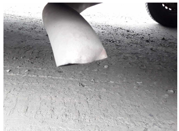
Beschädigung 2: Abgasanlage: Endschalldämpfer - verformt - instandsetzen