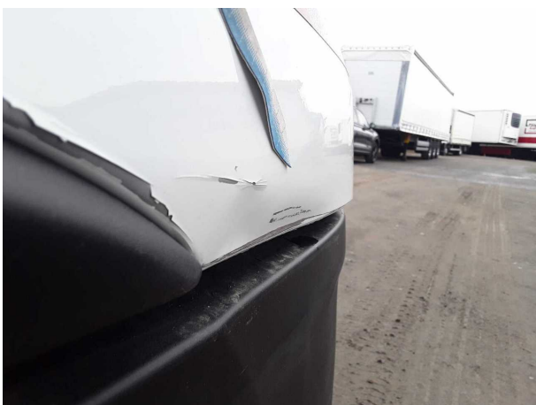
Beschädigung 8: Kotflügel rechts: Kotflügel rechts - verformt - erneuern