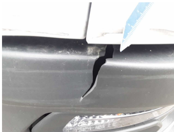
Beschädigung 9: Stossfänger vorn: Stossfänger vorn (unlackiert) - gebrochen / gerissen - erneuern