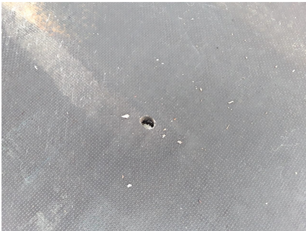
Beschädigung 5: Interieur: Laderaumboden - beschädigt - instandsetzen