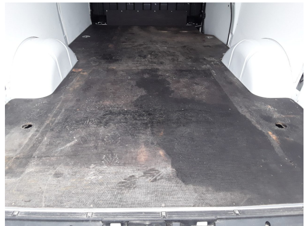
Beschädigung 5: Interieur: Laderaumboden - beschädigt - instandsetzen