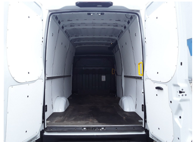
Abbildung 4: Sonstiges