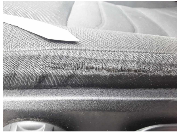
Beschädigung 3: Sitz vorn: Sitzbezug links - gebrochen / gerissen - instandsetzen