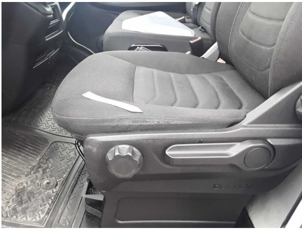
Beschädigung 3: Sitz vorn: Sitzbezug links - gebrochen / gerissen - instandsetzen