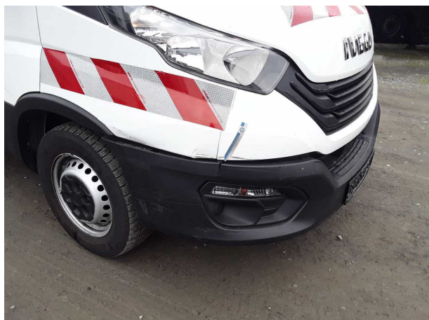
Beschädigung 9: Stossfänger vorn: Stossfänger vorn (unlackiert) - gebrochen / gerissen - erneuern