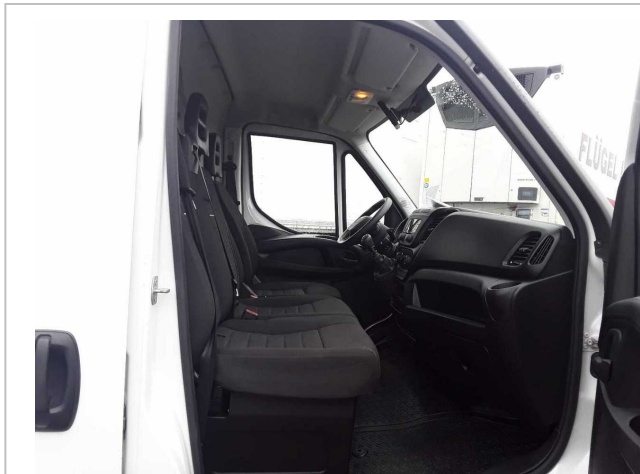
Abbildung 1: Innenraum