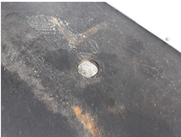
Beschädigung 5: Interieur: Laderaumboden - beschädigt - instandsetzen