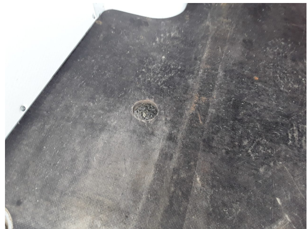
Beschädigung 5: Interieur: Laderaumboden - beschädigt - instandsetzen