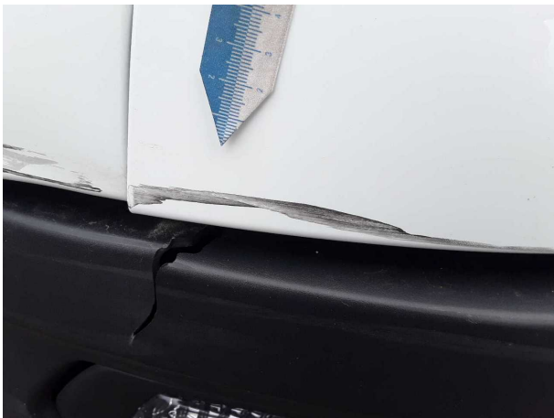
Beschädigung 6: Stossfänger vorn: Stossfänger vorn - verkratzt / verschürft - lackieren