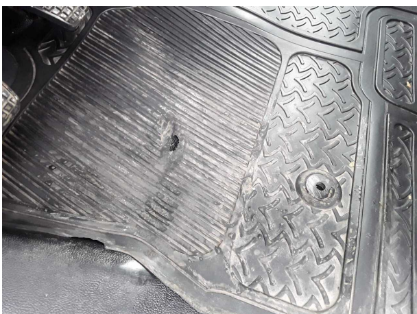
Beschädigung 1: Verkleidungen/Abdeckungen: Fußmatten - gebrochen / gerissen - erneuern