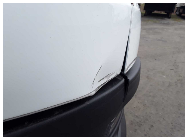
Beschädigung 8: Kotflügel rechts: Kotflügel rechts - verformt - erneuern