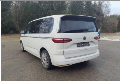
Ansicht hinten links