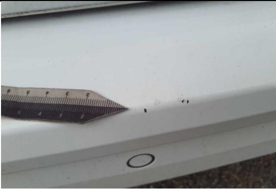
Stoßfänger hinten Lackabplatzer