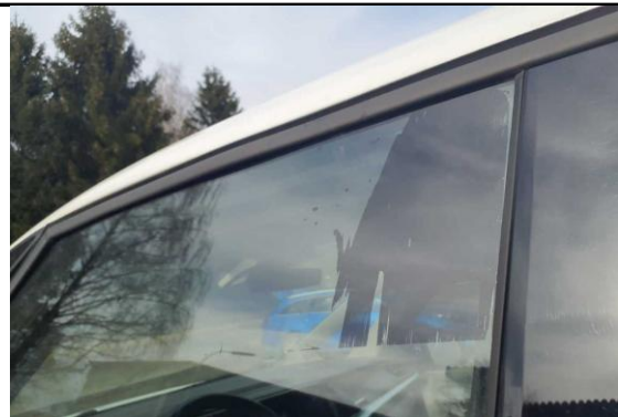
Scheibe vorne links beklebt