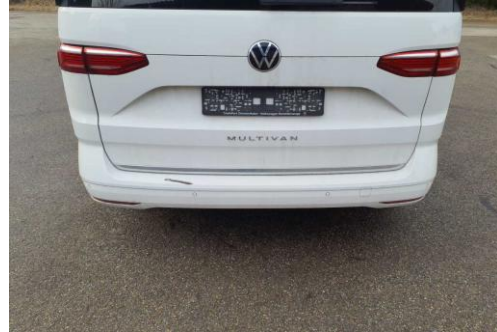
Stoßfänger hinten Lackabplatzer