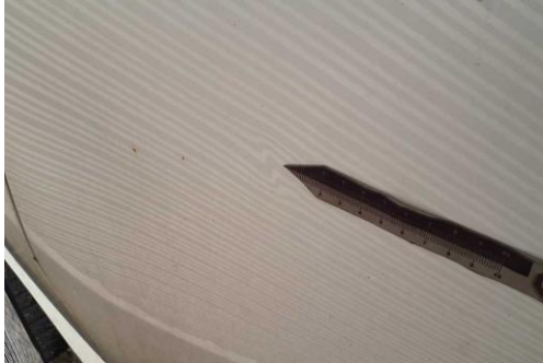
Tür vorn links Dellen