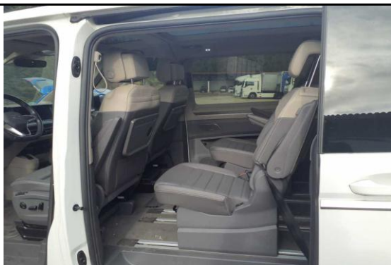
Ansicht Sitze hinten