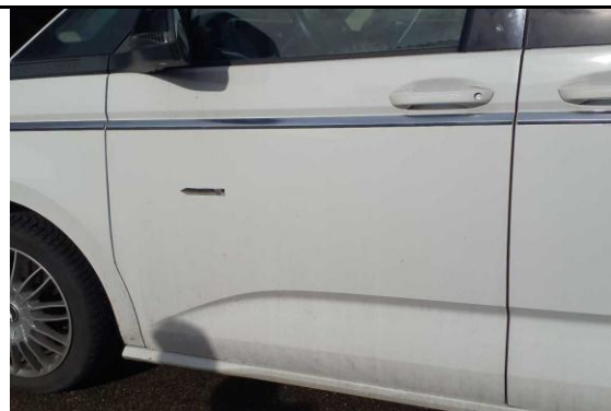
Tür vorn links Dellen