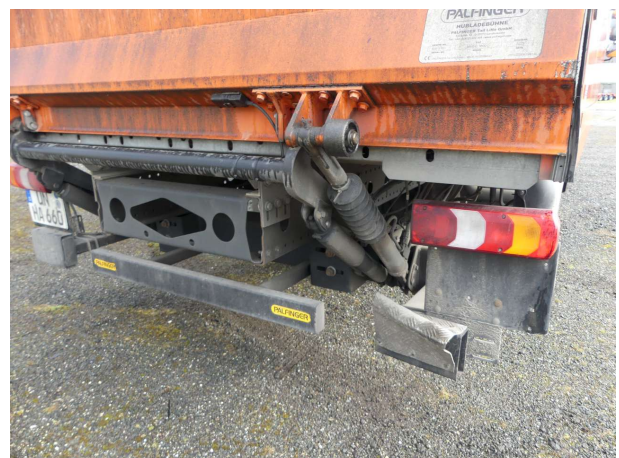
Beschädigung 1: Rahmen: Unterfahrschutz hinten (rechts) - verformt - erneuern