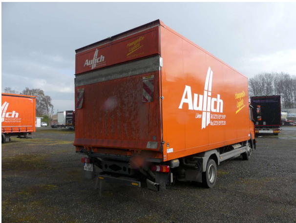
Abbildung 1: Schräg hinten