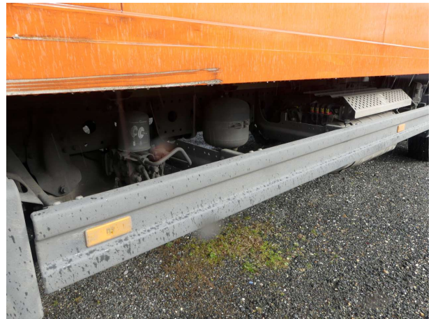
Beschädigung 6: Koffer: Unterzug rechts (rechts) - verkratzt / verschürft - instandsetzen und lackieren