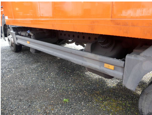
Beschädigung 5: Koffer: Seitenwand links - Delle / Lackschaden - lackieren