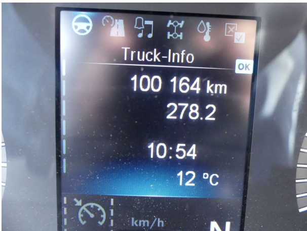
Abbildung 3: Innenraum