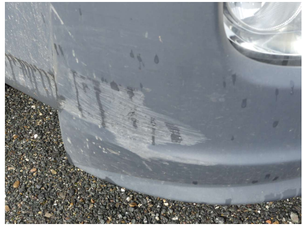
Beschädigung 2: Stossfänger vorn: Stossfänger vorn rechts - verkratzt / verschürft - erneuern