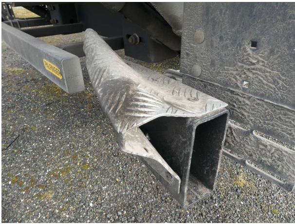
Beschädigung 1: Rahmen: Unterfahrerschutz hinten (rechts) - verformt - erneuern