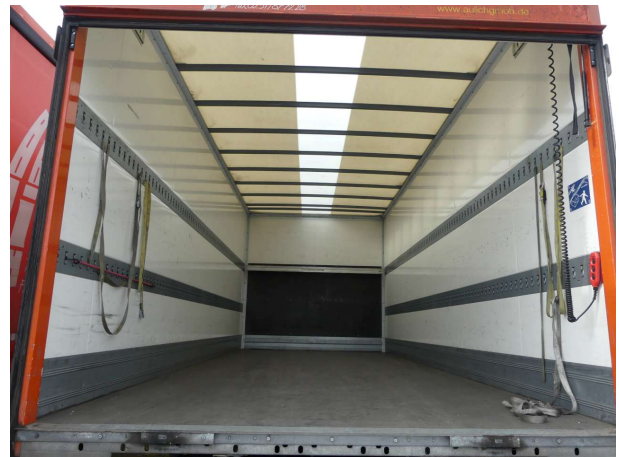
Abbildung 4: Laderaum