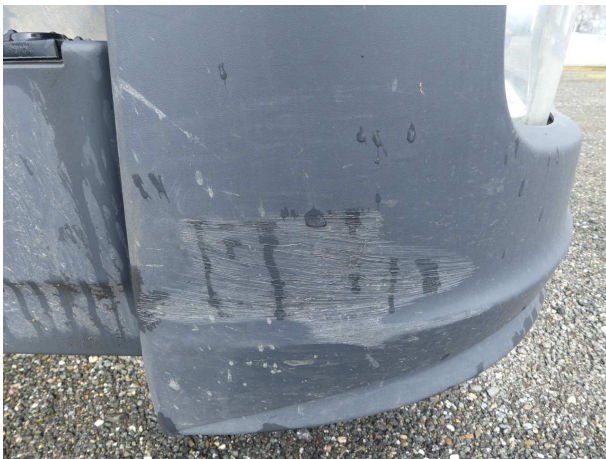
Beschädigung 2: Stossfänger vorn: Stossfänger vorn rechts - verkratzt / verschürft - erneuern