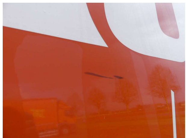
Beschädigung 7: Koffer: Seitenwand rechts - Delle / Lackschaden - instandsetzen und lackieren