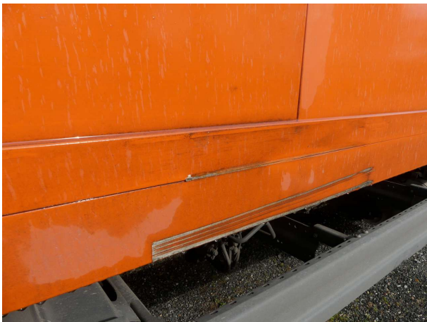
Beschädigung 6: Koffer: Unterzug rechts (rechts) - verkratzt / verschürft - instandsetzen und lackieren