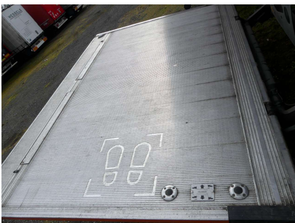
Abbildung 5: Laderaum