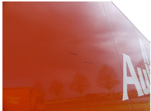
Beschädigung 5: Koffer: Seitenwand links - Delle / Lackschaden - lackieren