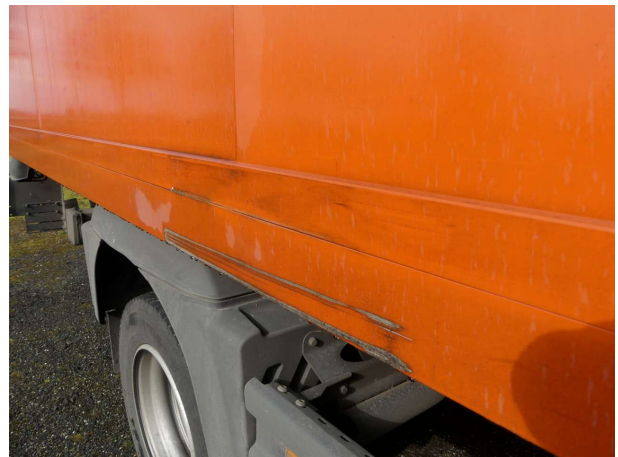
Beschädigung 6: Koffer: Unterzug rechts (rechts) - verkratzt / verschürft - instandsetzen und lackieren