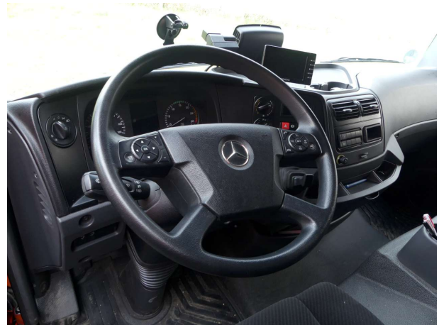
Abbildung 2: Innenraum