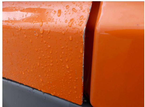
Beschädigung 3: Tür vorn links: Tür (im Kantenbereich) - Kratzer - Smart Repair