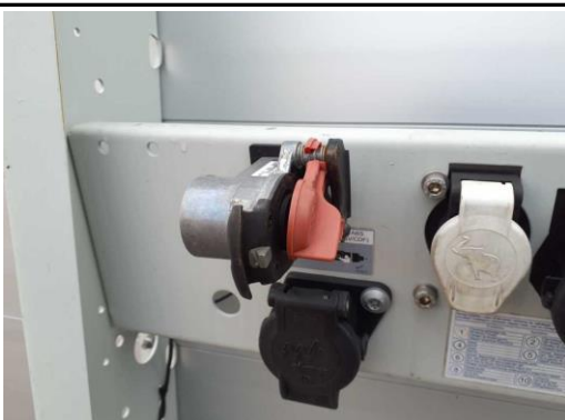
Staubschutzkappe Kupplungskopf gebr.