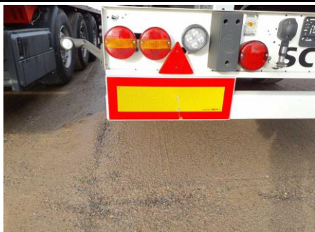
Warnschild hinten links Kratzer