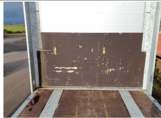
Stirnwand Holz beschädigt