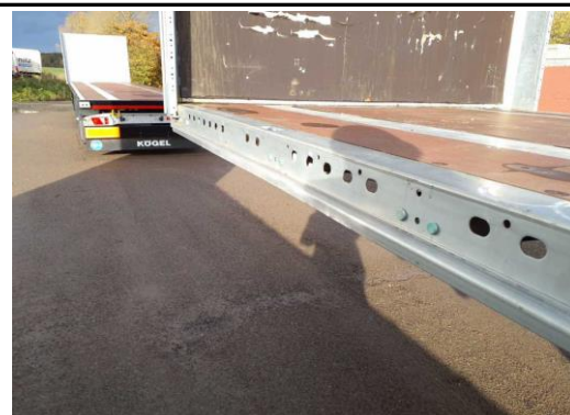
Abschlußrahmen links verformt