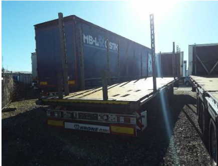
Ansicht hinten links