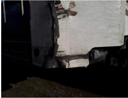
Stirnwanddecke vorne rechts verformt