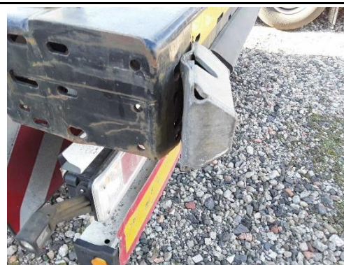
Anfahrpuffer gebrochen / gerissen