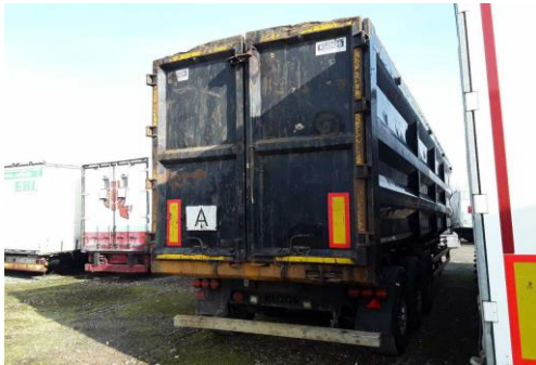
Ansicht hinten rechts