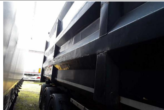
Aufbau Beulen und Korrosion