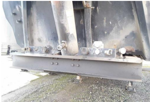
Hydraulikschlauch Kippzylinder fehlt