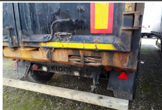
Portalrahmen hinten verformt / korrodiert