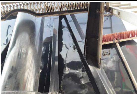
Stirnwand durchstoßen / verformt