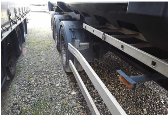
Seitenanfahrtschutz und Halterung rechts verformt