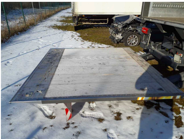
Abbildung 5: Ansicht Ladebordwand