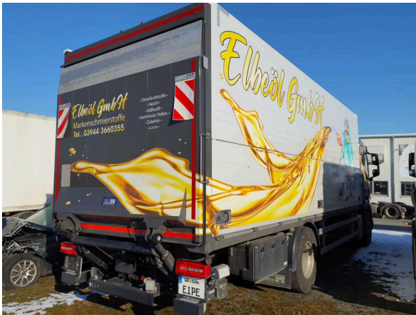
Abbildung 1: Ansicht hinten rechts