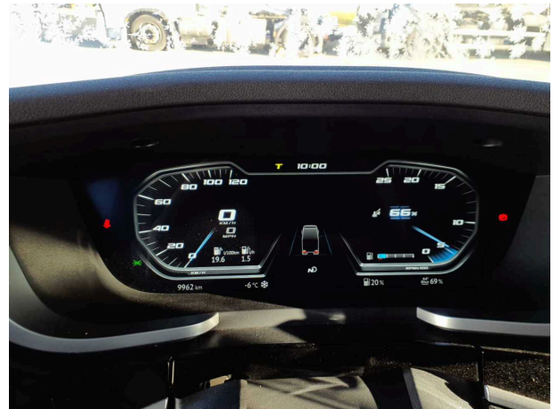
Abbildung 2: Ansicht Kombiinstrument