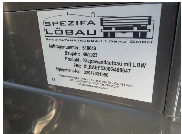
Abbildung 6: Ansicht Typschild Aufbau