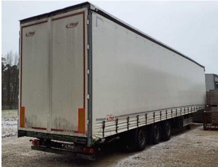
Ansicht hinten rechts