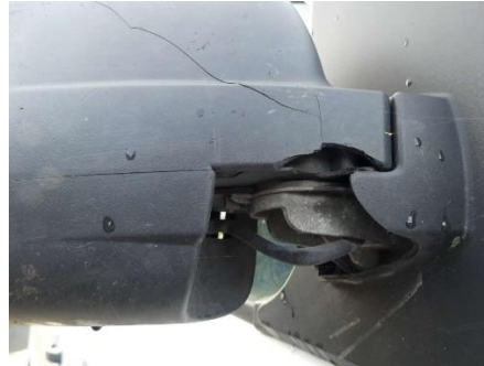
Außenspiegel rechts gebrochen