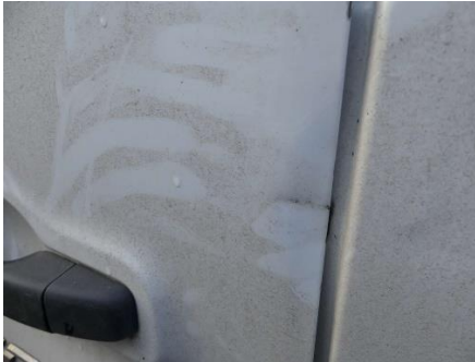
Hecktür links verformt