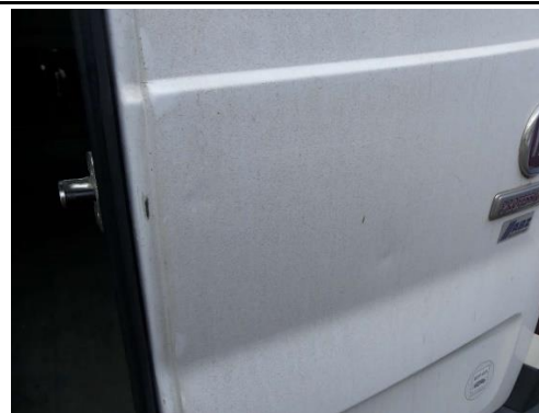
Tür hinten rechts Delle