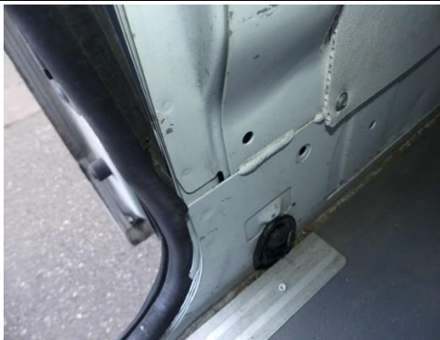
Türdichtung Schiebetür gebrochen