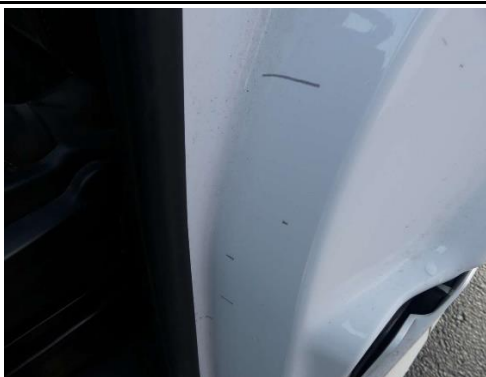
B-Säule links verkratzt