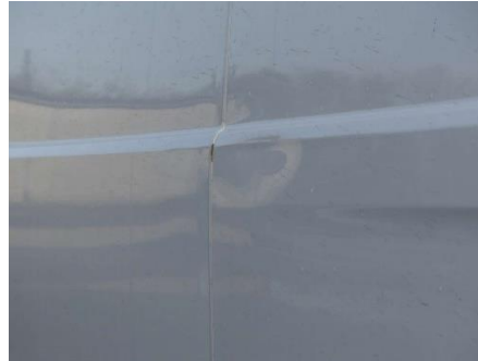
Seitenwand links Delle