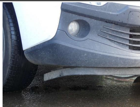
Spoiler Stoßfänger vorne gebrochen