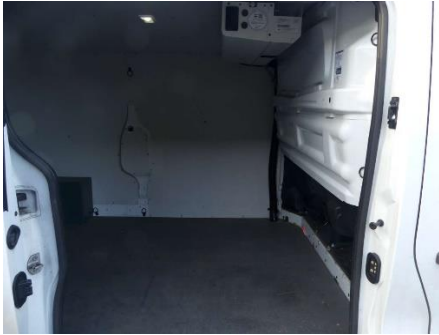
Ansicht Laderaum seitlich