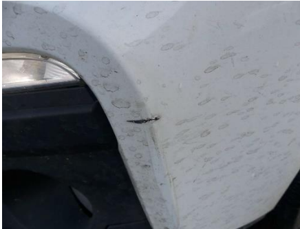
Stoßfänger vorne verschürft