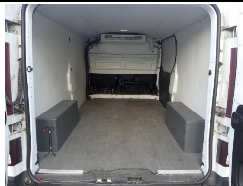
Ansicht Laderaum hinten