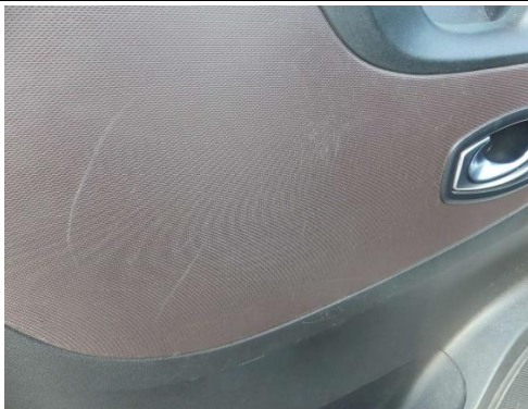
Türverkleidung Fahrertür verkratzt