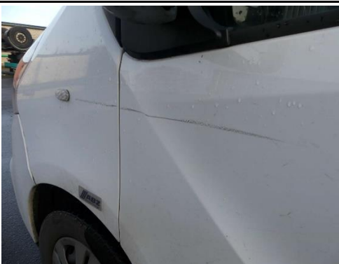
Kotflügel/Tür rechts Abrieb