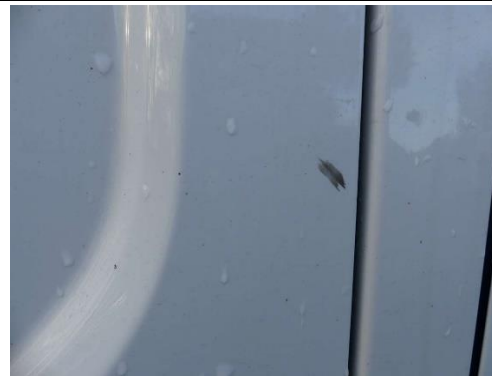
B-Säule rechts Delle