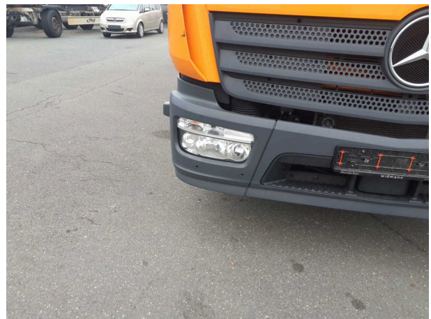
Beschädigung 1: Zusatzleuchte: Tagfahrlicht (Rechts) - ohne Funktion - erneuern