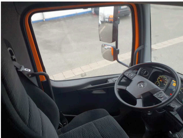
Abbildung 3: Innenraum