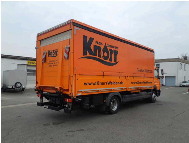
Abbildung 1: Schräg hinten