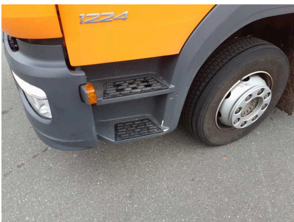
Gebrauchsspur 1: Anbauteil links: Einstieg unten - verkratzt / verschürft - kein Abzug