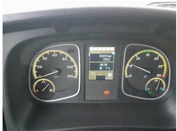
Abbildung 2: Innenraum