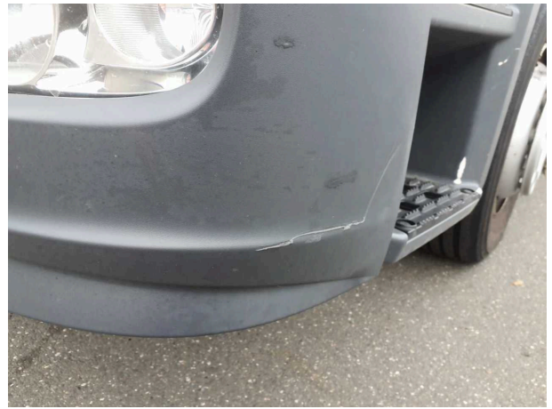
Beschädigung 5: Stossfänger vorn: Stossfänger vorn links - verkratzt / verschürft - erneuern