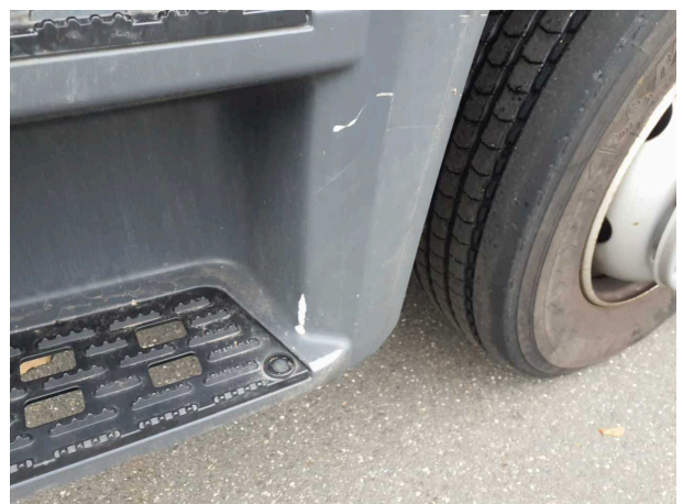
Gebrauchsspur 1: Anbauteil links: Einstieg unten - verkratzt / verschürft - kein Abzug