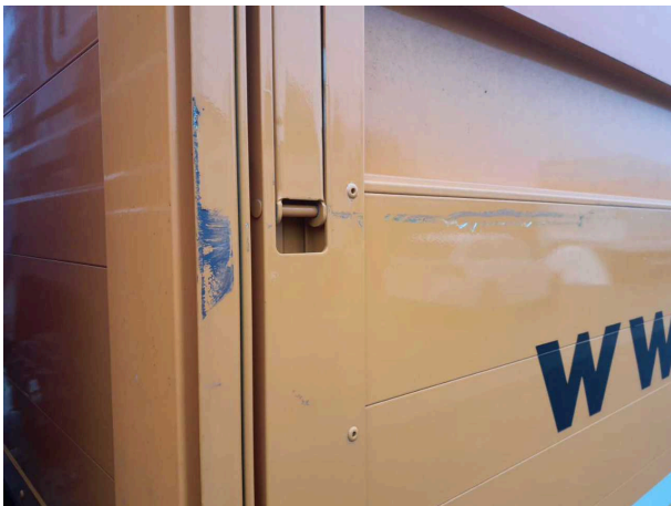
Beschädigung 8: Pritsche/Plane: Bordwandklappe links vorn - verkratzt / verschürft - lackieren