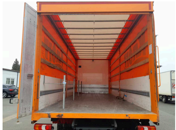
Abbildung 4: Sonstiges