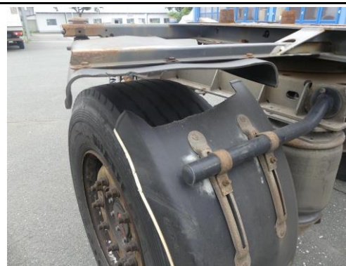
Kotflügel vorne rechts gebrochen