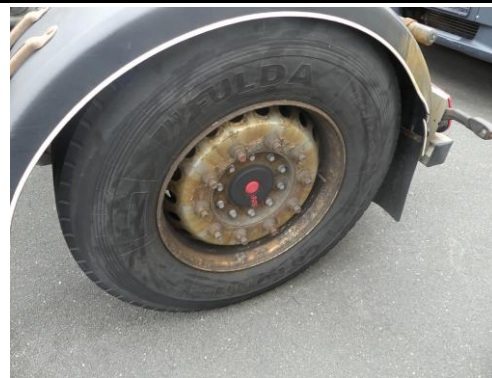
Kotflügel hinten links gebrochen