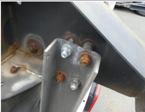
Aufnahme Unterfahrschutz hinten verformt