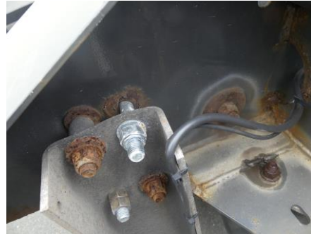
Aufnahme Unterfahrschutz hinten verformt