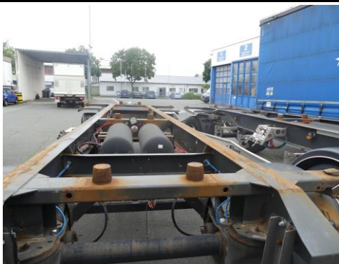
Ansicht Aufnahme Wechselbrücken