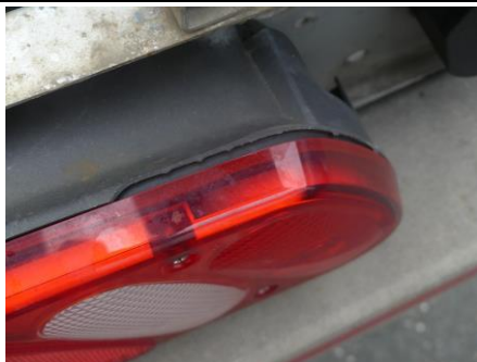
Schlusslicht links gebrochen