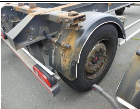
Kotflügel hinten rechts gebrochen