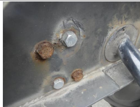
Aufnahme Unterfahrschutz hinten verformt