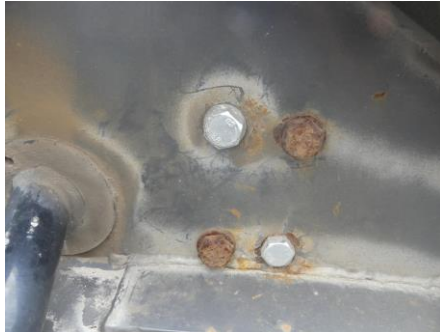
Aufnahme Unterfahrschutz hinten verformt