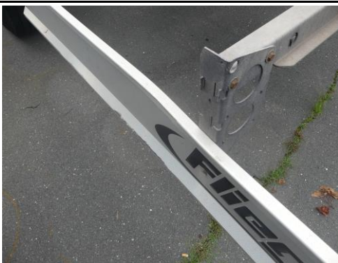
Unterfahrschutz rechts verformt