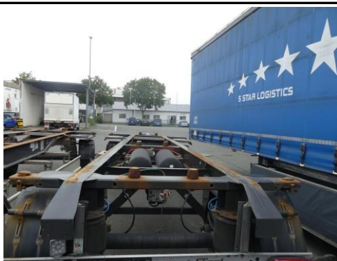
Ansicht Aufnahme Wechselbrücken