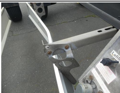
Halter Unterfahrschutz verformt