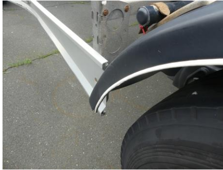
Kotflügel hinten links verformt