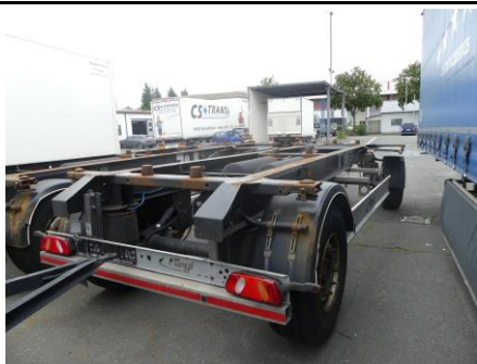
Ansicht hinten rechts