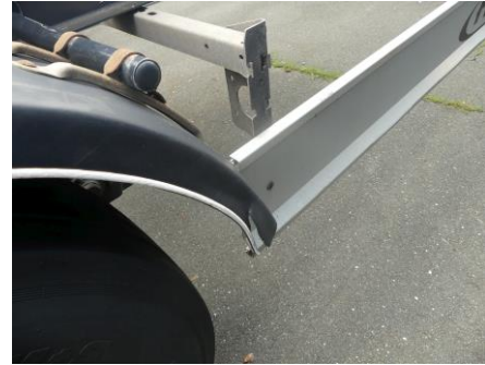
Kotflügel hinten rechts gerissen