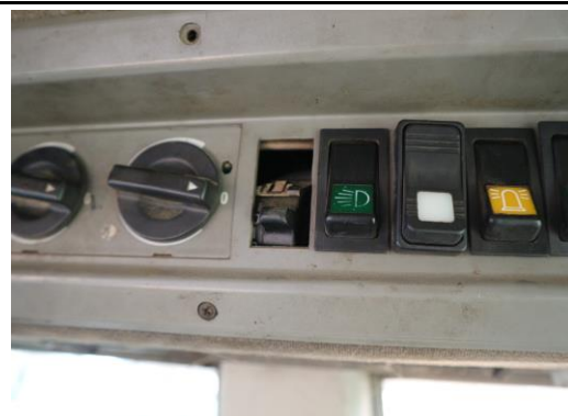
2x Schalter gebrochen