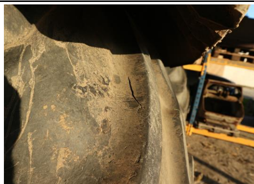
Reifen hinten rissig, schnittbeschädigt