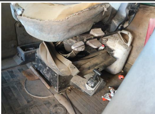
Schlepperkabine stark verschmutzt