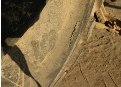
Reifen hinten rissig, schnittbeschädigt