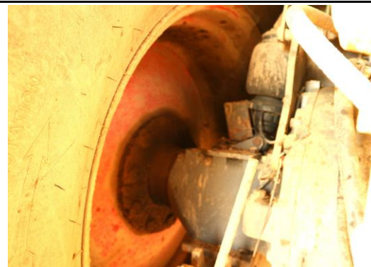
Achsantrieb hinten links undicht