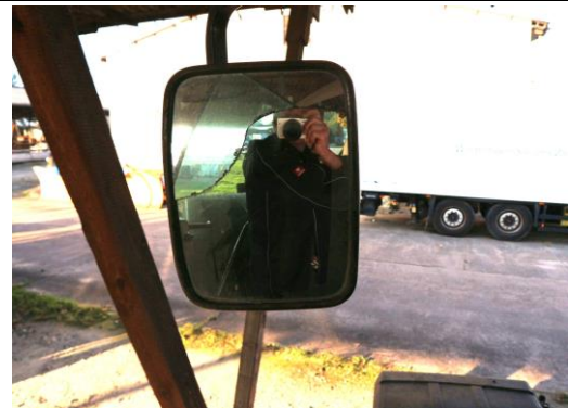
Spiegel links gebrochen