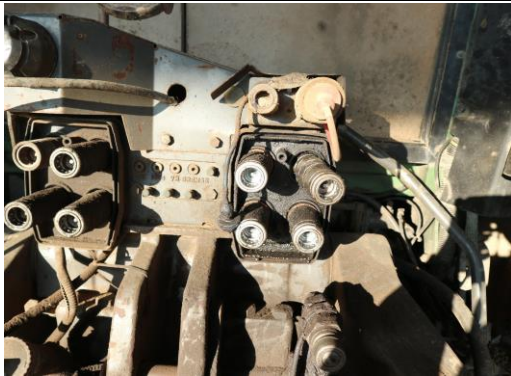
Hydraulikkupplungen rechts undicht