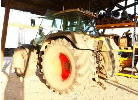
Ansicht hinten links