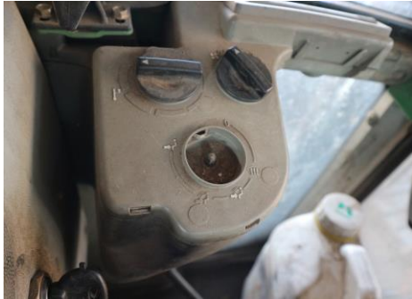
Knopf Lüftung fehlt