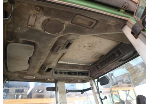
Dachverkleidung gerissen, verschmutzt