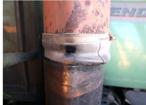
Verbindung Schalldämpfer n. fachgerecht inst.