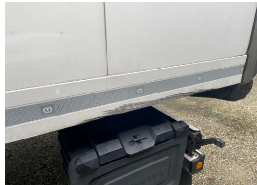
Untergurt hinten links verschürft, verformt