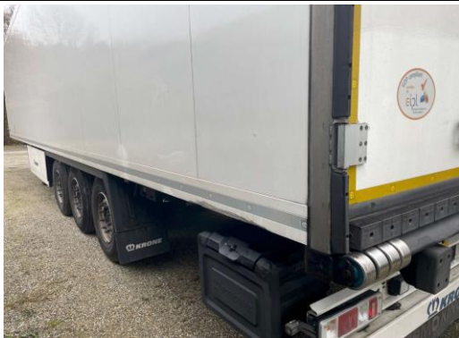
Untergurt hinten links verschürft, verformt