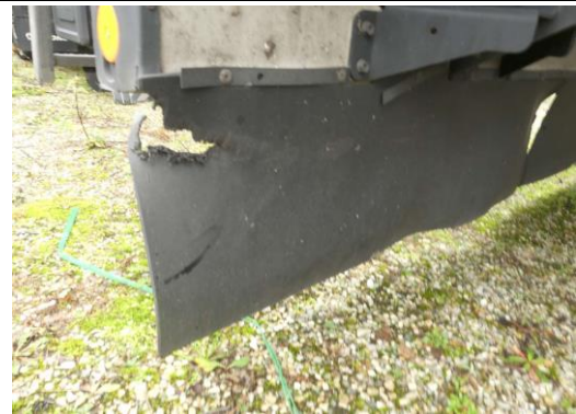
Spritzschutz Heck rechts eingerissen