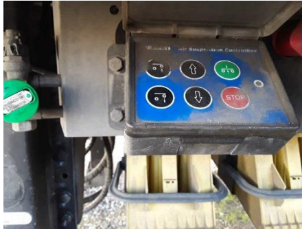
Ansicht Bedienung Luftfederung