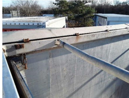
Querstrebe Rollplane verformt