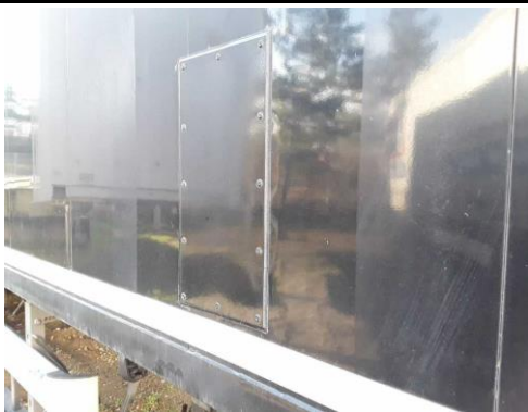
Seitenwand instand gesetzt