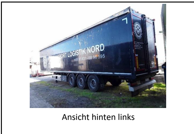
Ansicht hinten links