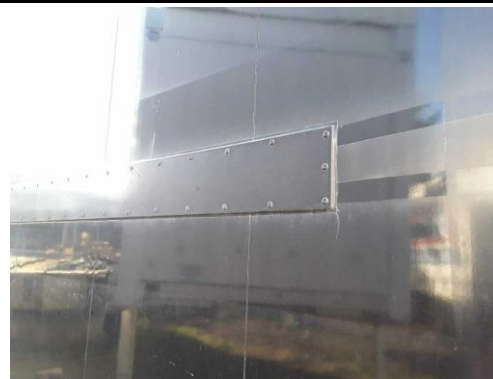
Seitenwand instand gesetzt