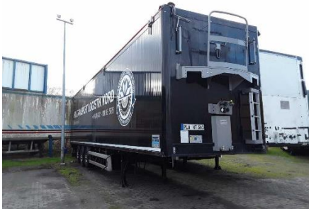
Ansicht vorne rechts