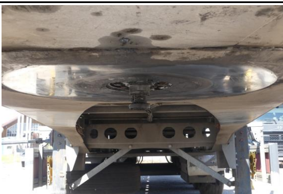
Ansicht Königsbolzen / Sattelstützen