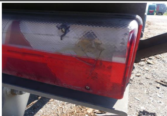
Glas Rückleuchte rechts gebrochen