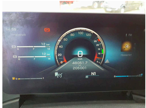
Abbildung 2: Ansicht Kombiinstrument