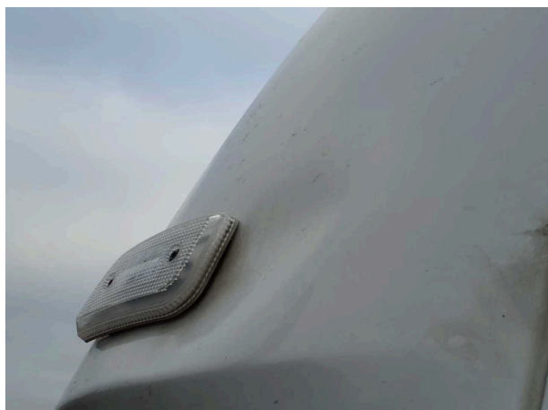
Beschädigung 3: Fahrzeugdach: Dach - Delle(n) - Smart Repair