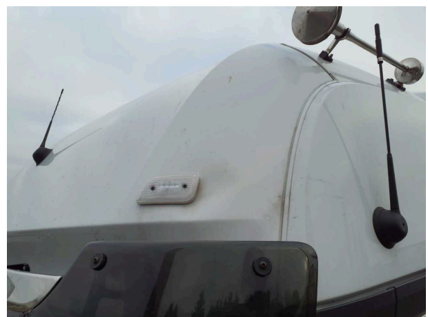
Beschädigung 3: Fahrzeugdach: Dach - Delle(n) - Smart Repair