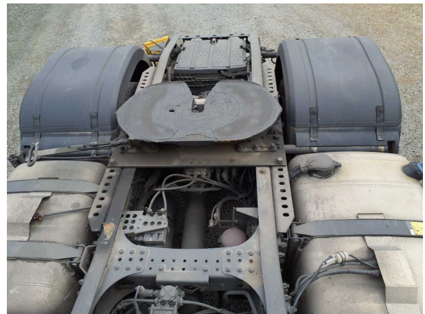
Abbildung 4: Ansicht Sattelplatte