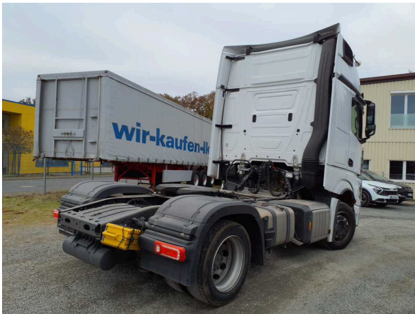
Abbildung 1: Schräg hinten