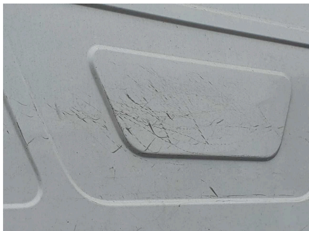
Beschädigung 4: Fahrerhaus: Rückwand - Kratzer - lackieren