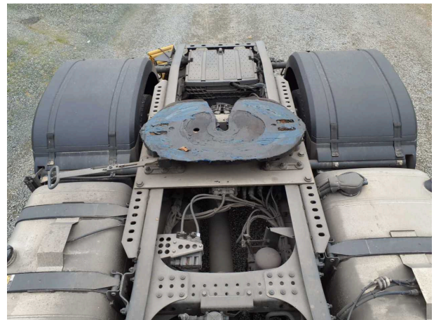
Abbildung 4: Ansicht Sattelplatte