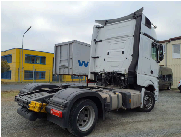
Abbildung 1: Schräg hinten