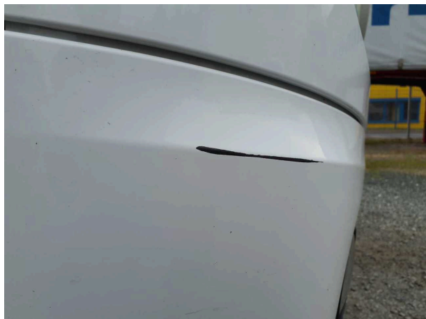
Beschädigung 3: Stossfänger vorn: Bugschürze rechts - gebrochen / gerissen - instandsetzen und lackieren