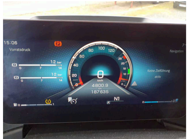
Abbildung 2: Ansicht Kombiinstrument