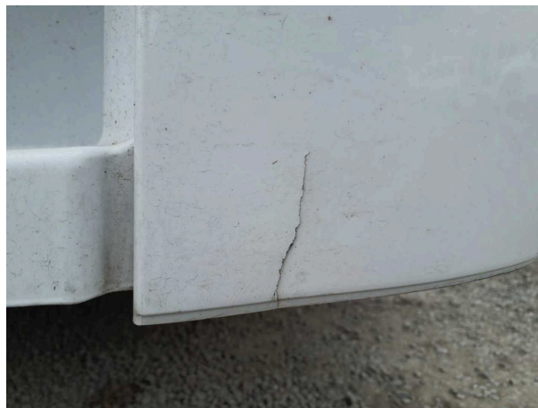
Beschädigung 3: Stossfänger vorn: Bugschürze rechts - gebrochen / gerissen - instandsetzen und lackieren