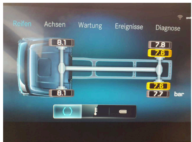
Beschädigung 1: Rad/Reifen: Reifen hinten (Druckanzeige) - Funktion / Zulässigkeit - befunden ggf. instandsetzen