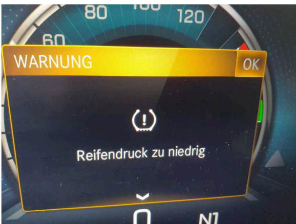
Beschädigung 1: Rad/Reifen: Reifen hinten (Druckanzeige) - Funktion / Zulässigkeit - befunden ggf. instandsetzen