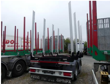
Ansicht hinten links