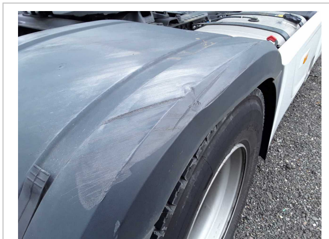
Beschädigung 4: Rahmen: Kotflügelabdeckung hinten rechts - verformt - erneuern