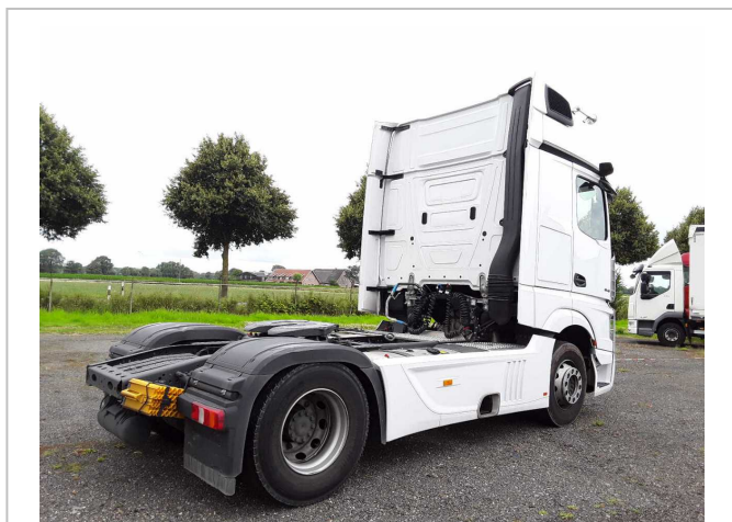
Abbildung 1: Schräg hinten