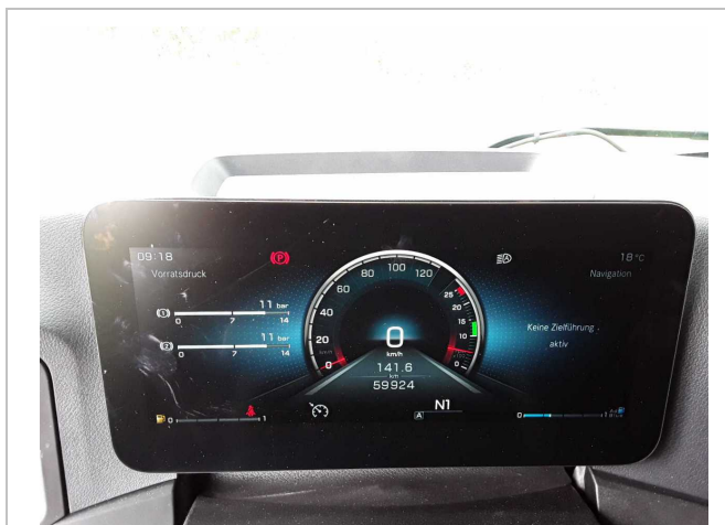
Abbildung 2: Innenraum