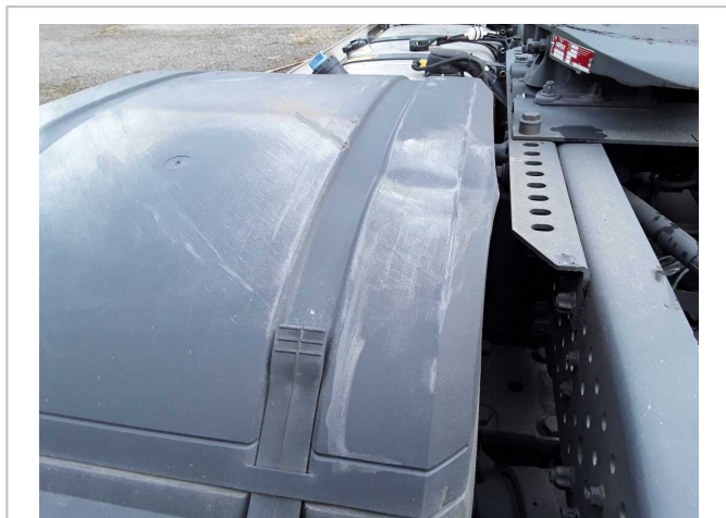
Beschädigung 3: Rahmen: Kotflügelabdeckung hinten links - verformt - erneuern