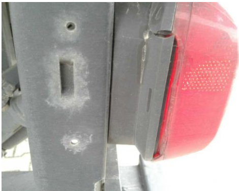
Heckleuchten links / rechts gebrochen