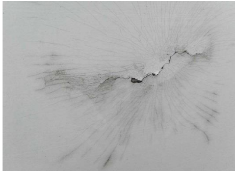
Seitenwände links / rechts gerissen