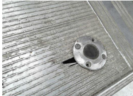
Fußschalter o.F. / Alublatt gerissen