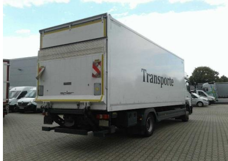
Ansicht hinten rechts