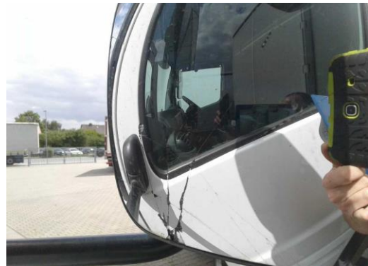
Weitwinkelspiegelglas rechts gerissen