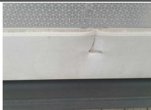
Unterzug rechts verformt