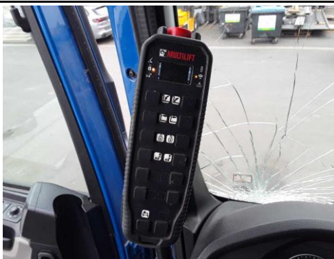
Ansicht Bedienung Lifthacken