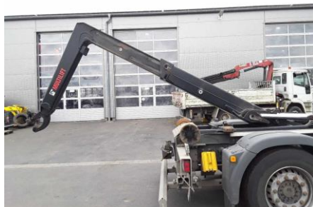
Ansicht Lifthacken ausgefahren