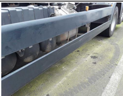
Seitenanfahrerschutz links verkratzt/verschürft