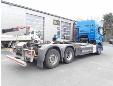
Ansicht hinten rechts