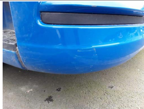
Stoßfängerecke rechts verkratzt/verschürft