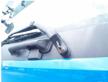
Abdeckung Wischerarm fehlt