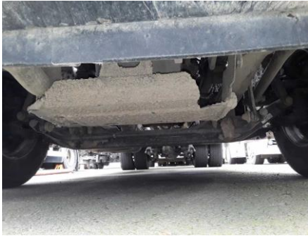
Verkleidung Unterfahrschutz gebrochen