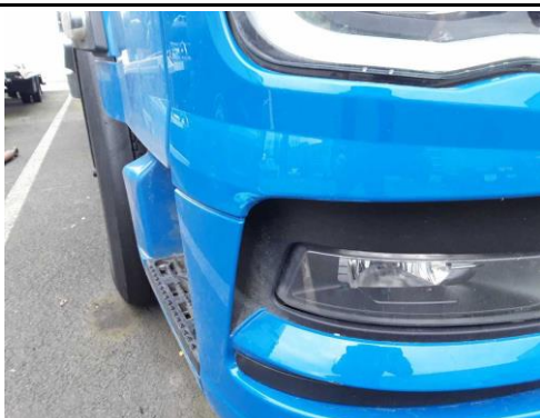
Scheinwerferblende rechts verkratzt/verschürft