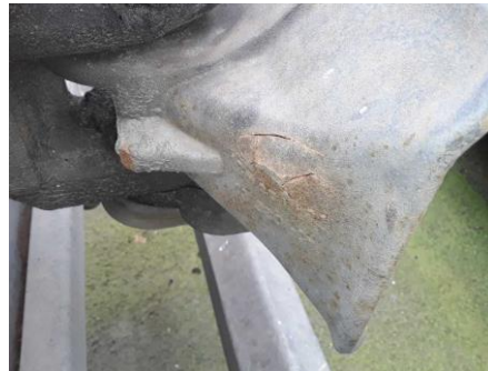
Fangmaul Anhängerkupplung gebrochen