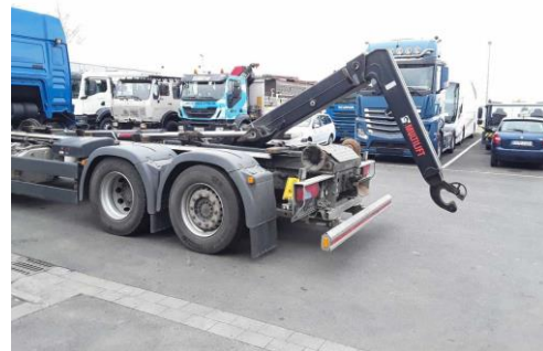
Ansicht Lifthacken ausgeklappt