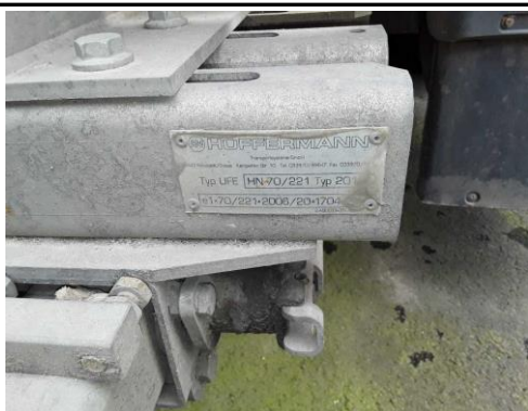
Typschild Unterfahrerschutz teleskopierbar