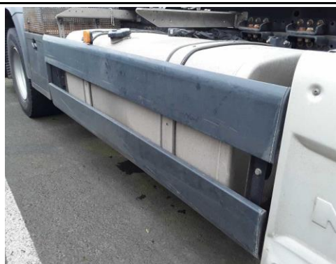
Seitenanfahrerschutz rechts verkratzt/verschürft