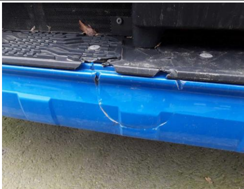
Stoßfänger Mittelteil gebrochen