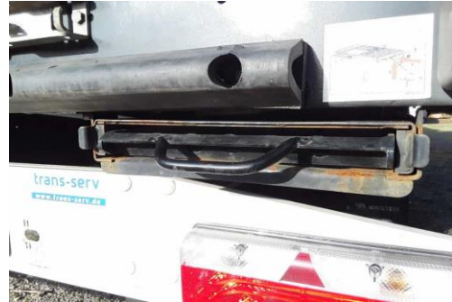
Aufstiegsleiter lässt sich nicht ausziehen