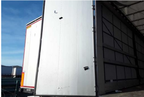
Stange für Schieberverdeck fehlt