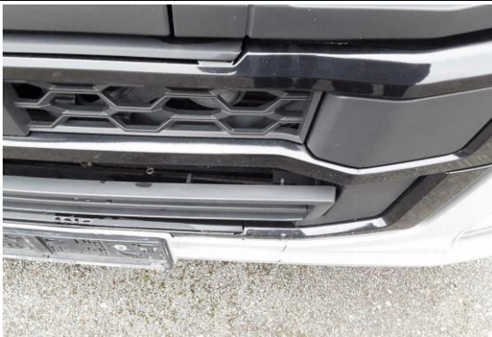
Verkleidung am Aufstieg gebrochen