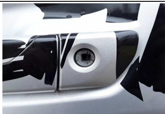
Türschloß links beschädigt