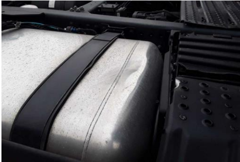
Tank rechts verformt