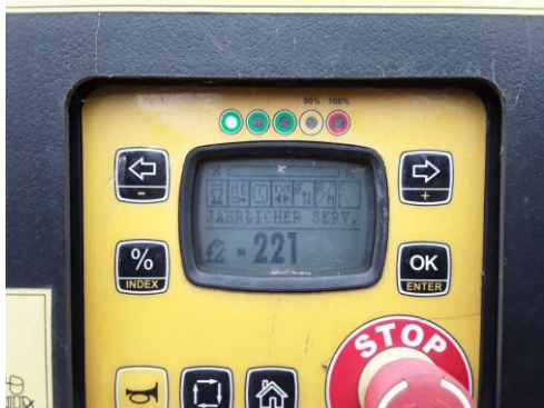
Wartung Ladekran fällig