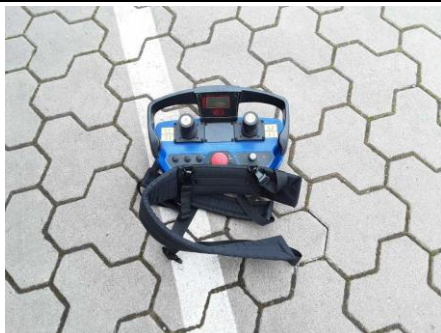
Ansicht Fernbedienung Ladekran