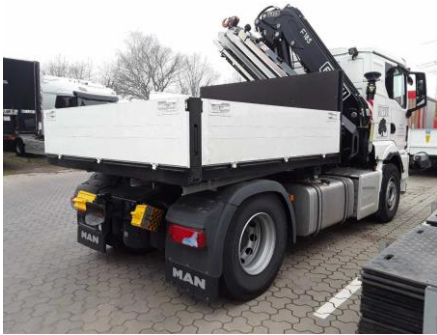
Ansicht hinten rechts