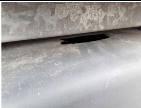
Radabdeckung links gebrochen