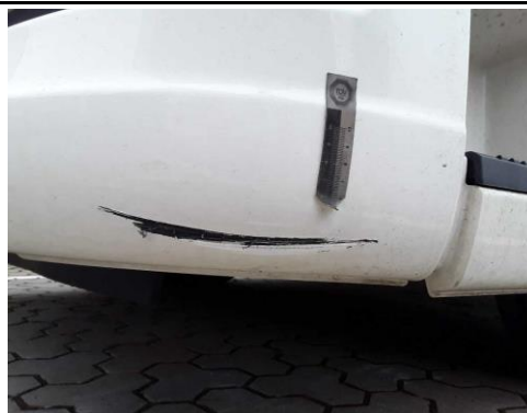
Stpfänger vorne links verschürft