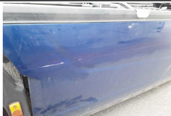
Rahmenverkleidung rechts verkratzt