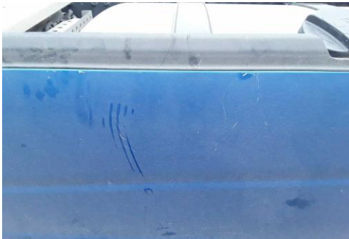
Rahmenverkleidung links verkratzt