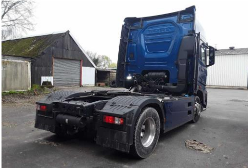
Ansicht hinten rechts