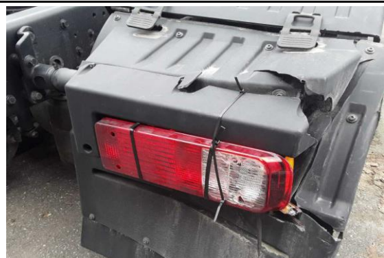
Rückleuchte rechts gebrochen, Halter verformt