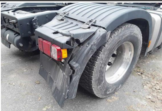
Kotflügel hinten rechts gebrochen / verformt