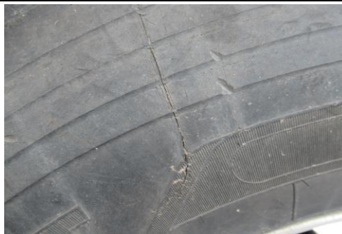
Reifen hinten rechts beschädigt