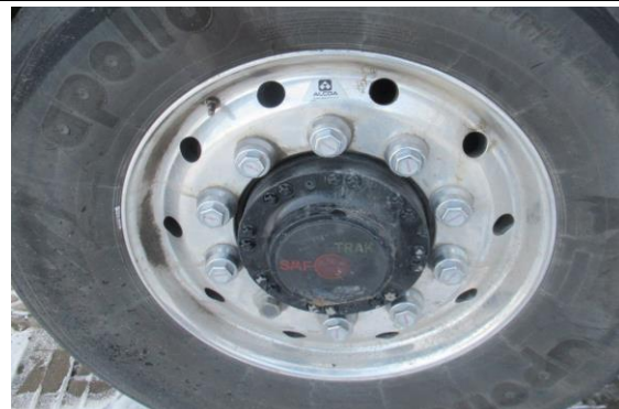
Ansicht 3. Achse hydr. angetrieben