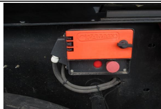
Ansicht Bedienung Schieberverdeck