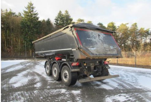
Ansicht hinten links