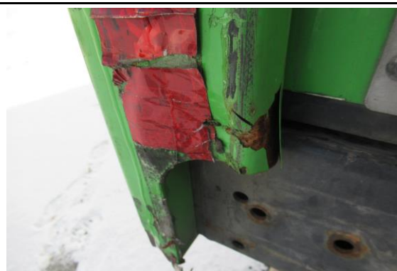
Portal hinten links verformt