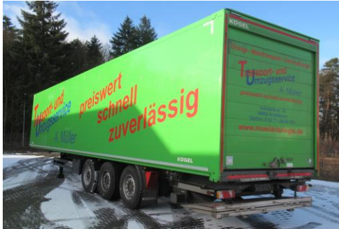
Ansicht hinten links