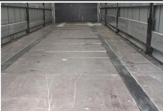
Ansicht Abdeckungen Coilmulde