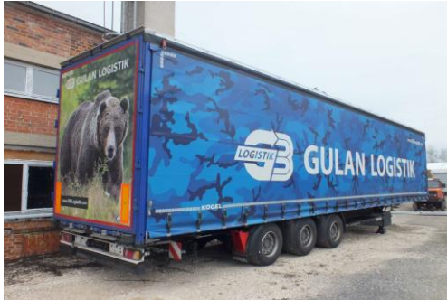
Ansicht hinten rechts