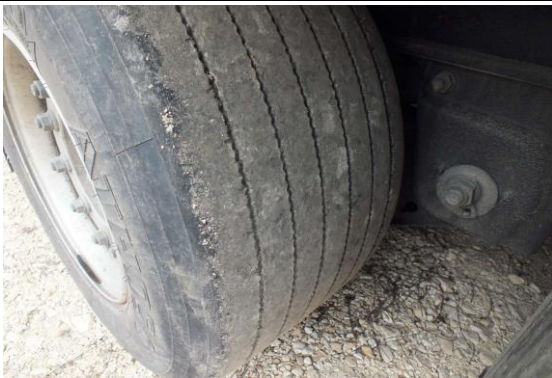
Reifen hinten rechts abfahren