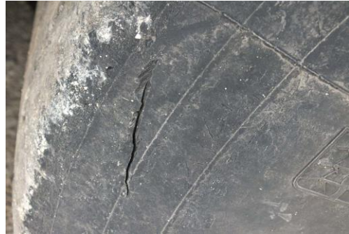
Reifen vorn rechts beschädigt