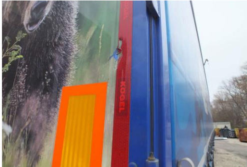
Portaltür rechts verformt