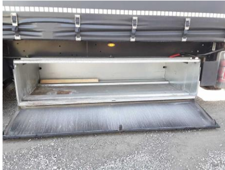
Ansicht Palettenstaukasten rechts