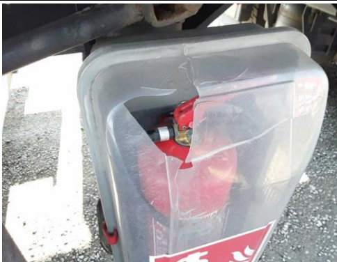
Deckel Staukasten feuerlöscher gebrochen