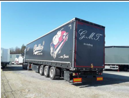
Ansicht hinten links