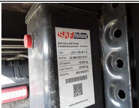
Ansicht Typenschild Sattelstützen