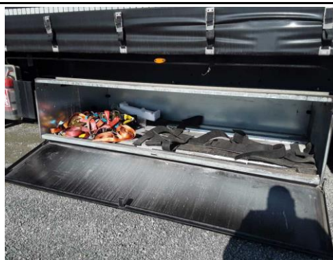
Ansicht Palettenstaukasten links