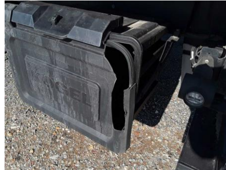
Deckel Staukasten gebrochen