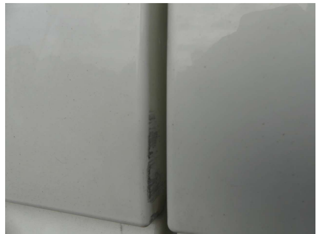
Beschädigung 2: Fahrerhaus: Seitenwand links - verkratzt / verschürft - Smart Repair