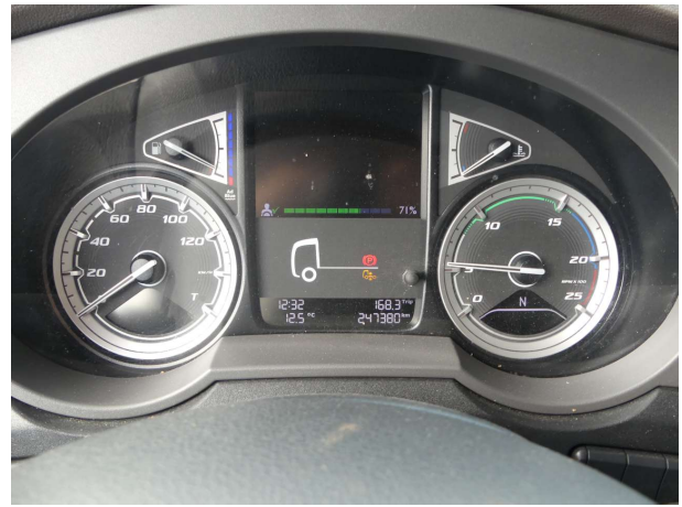
Abbildung 2: Innenraum