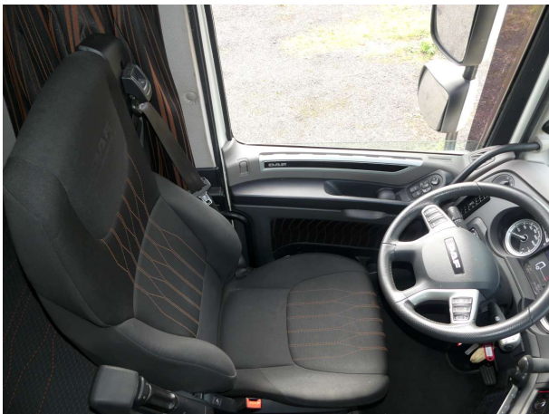
Abbildung 3: Innenraum