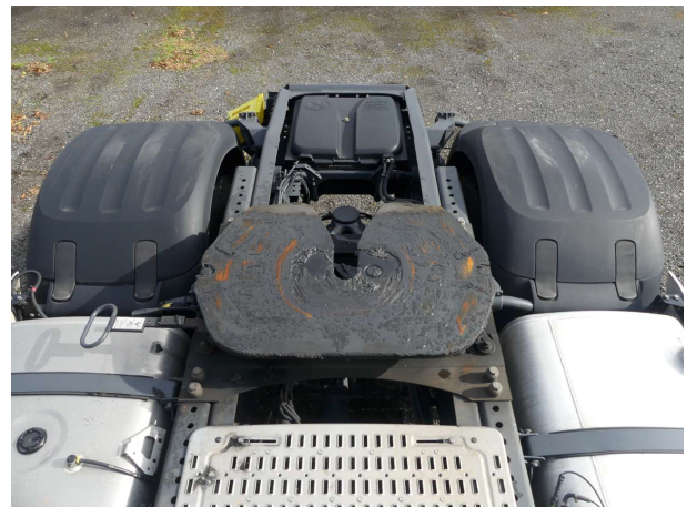
Abbildung 4: Sonstiges