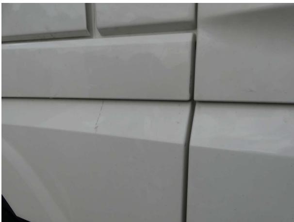
Beschädigung 2: Fahrerhaus: Seitenwand links - verkratzt / verschürft - Smart Repair