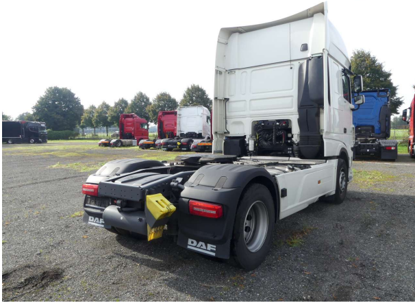
Abbildung 1: Schräg hinten