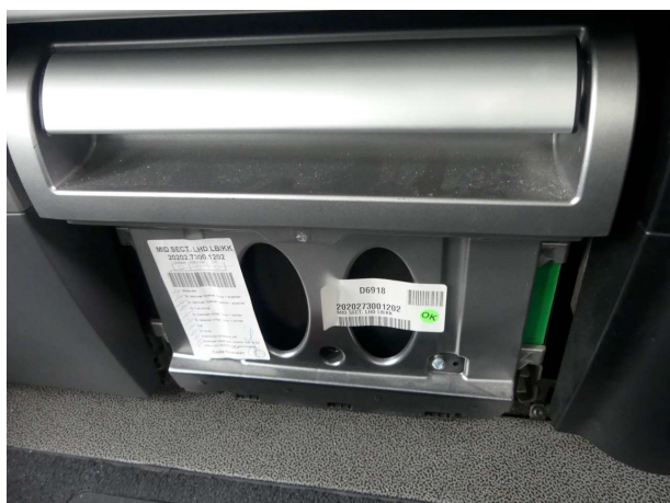
Beschädigung 3: Sitz hinten: Kühlschrank / -box (Abdeckung vorne) - fehlt - erneuern