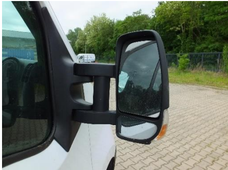
Außenspiegel rechts gebrochen