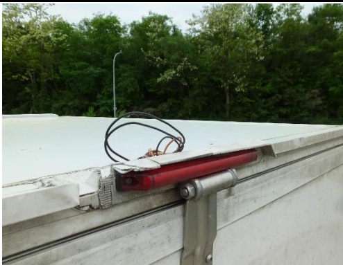
Regenkante Koffer hinten links verformt