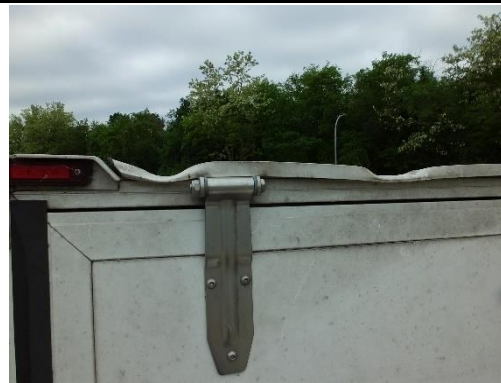
Regenkante Koffer hinten links verformt