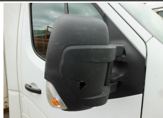
Außenspiegel rechts gebrochen