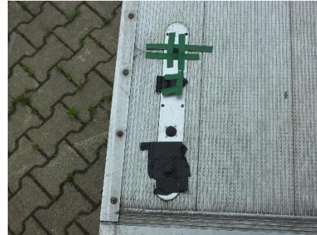
Fußschalter Ladebordwand ohne Funktion