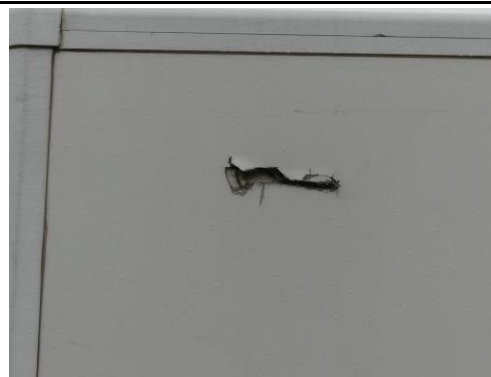
Seitenwand links Loch