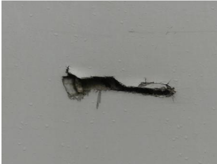
Seitenwand links Loch