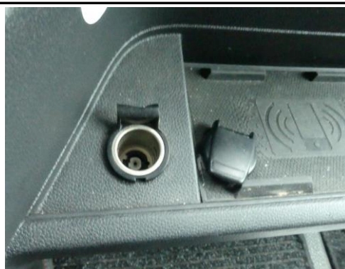
Abdeckung Zigarettenanzünder gebrochen