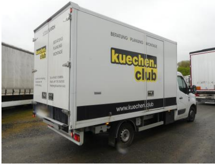
Ansicht hinten rechts