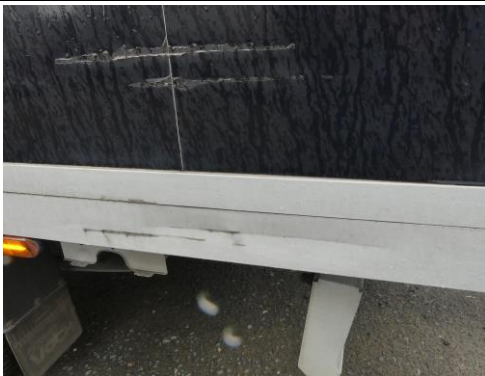
Unterzug links verformt