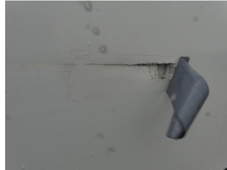
Seitenwand rechts Loch