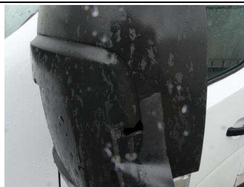
Spiegelabdeckung links gebrochen