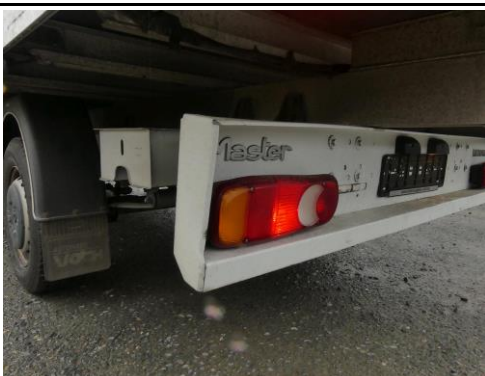
Unterfahrschutz links verformt