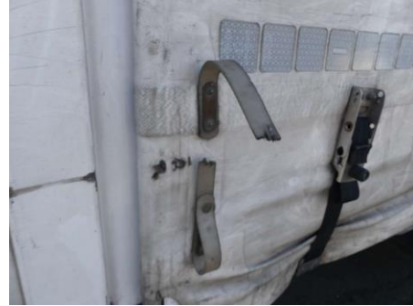
Portalrahmen re unten, verkratzt/verschürft