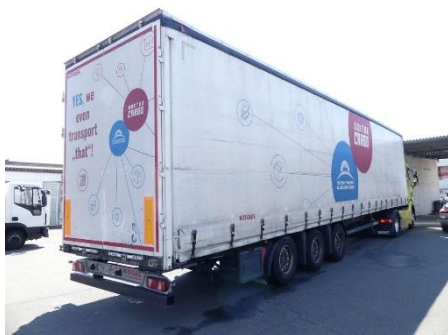
Ansicht hinten rechts