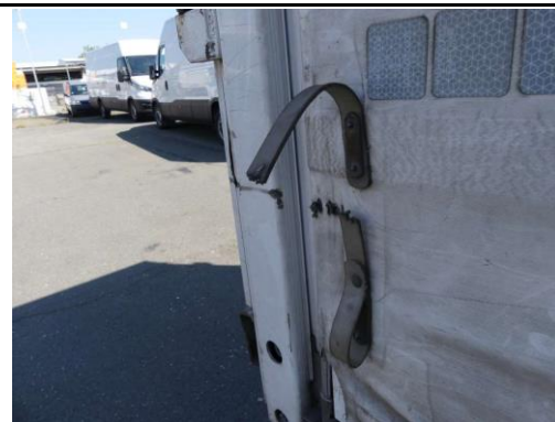
Planengriffe hinten links und rechte gerissen