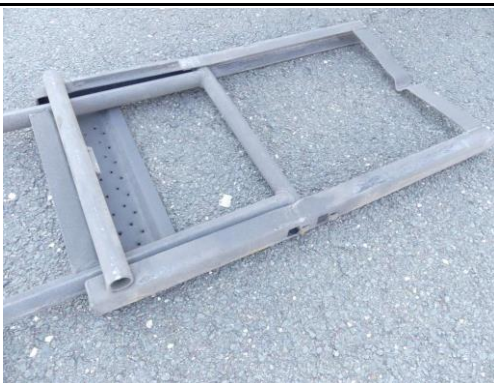
Leiter hinten rechts verformt