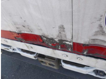
Tür hinten rechts verformt/Lackschaden