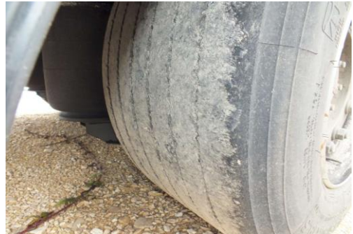
3 Reifen abgefahren