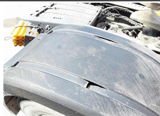
Kotflügelabdeckung rechts gebrochen