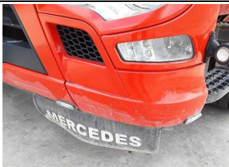
Bugschürze links verkratzt