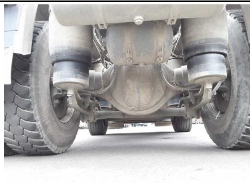
Fahrzeug / Unterboden stark verschmutzt