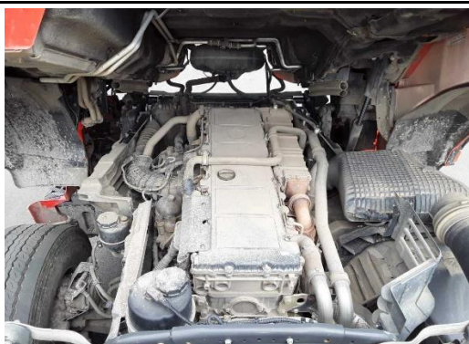
Fahrzeug / Unterboden stark verschmutzt