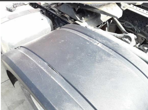
Kotflügelabdeckung links gebrochen