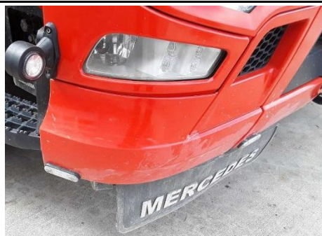
Bugschürze rechts verkratzt