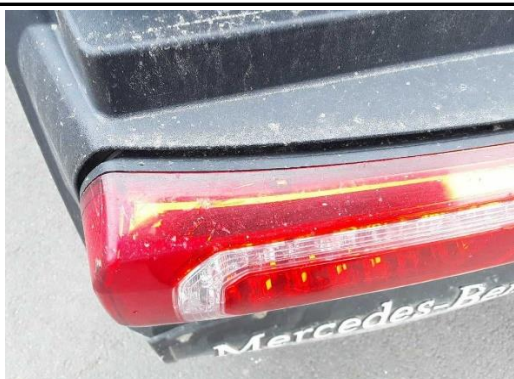
Rückleuchte (LED) links gebrochen