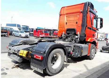
Ansicht hinten rechts