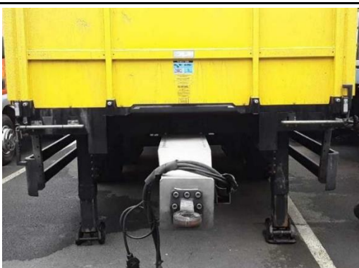
Ansicht Abstützung vorne