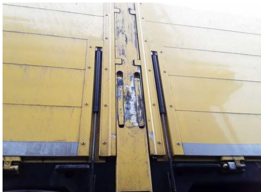
Bordwand / Mittelrunge Mitte links verkratzt