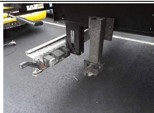
Ansicht Fallstütze Heck rechts