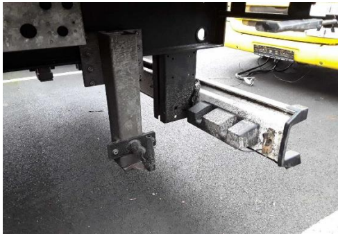
Ansicht Fallstütze Heck links