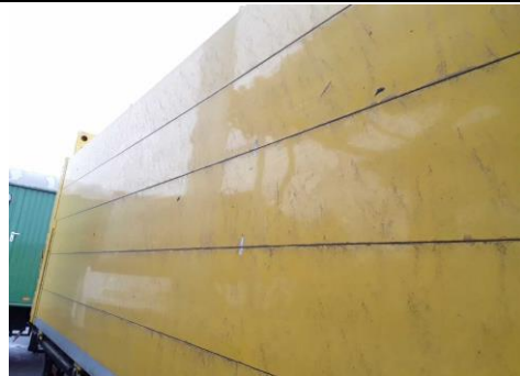
Bordwand vorne links verkratzt