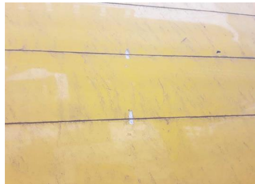
Bordwand hinten links verkratzt