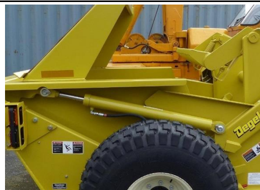
Ansicht Hydraulikzylinder Sammelraumleerung