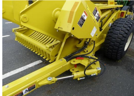
Ansicht hydraulische Deichselverstellung