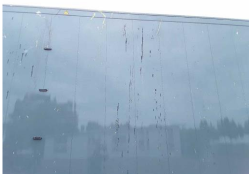
Seitenwand links verschmutzt / verkratzt