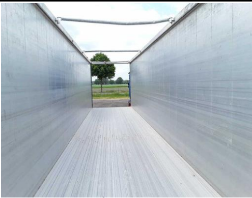
Planenhalter/Querstreben 3 Stk. Verformt