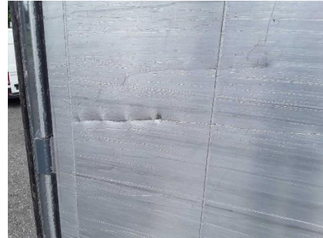
Seitenwand links innen Löcher