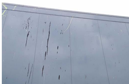
Seitenwand links verschmutzt