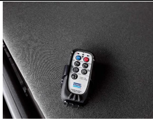
Fernbedienung ohne Funktion