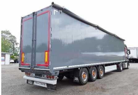
Ansicht hinten rechts