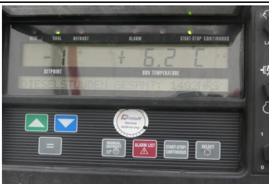
Ansicht Betriebsstunden Kühlaggregat