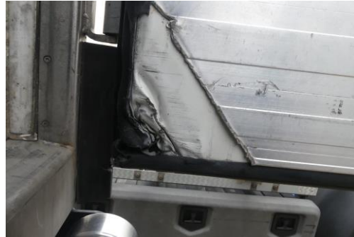
Portaltür rechts innen gebrochen