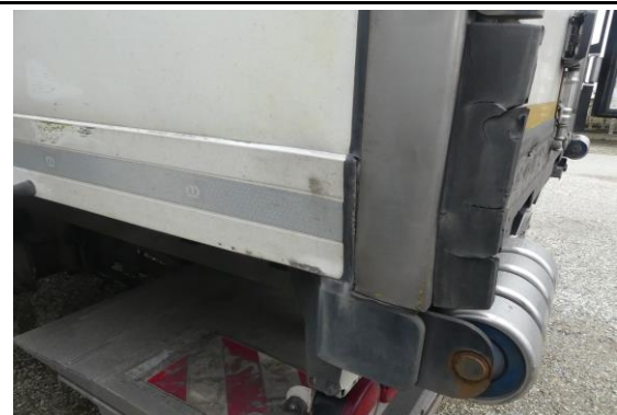
Seitenwand hinten links verformt