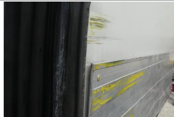
Portaltür hinten innen verformt