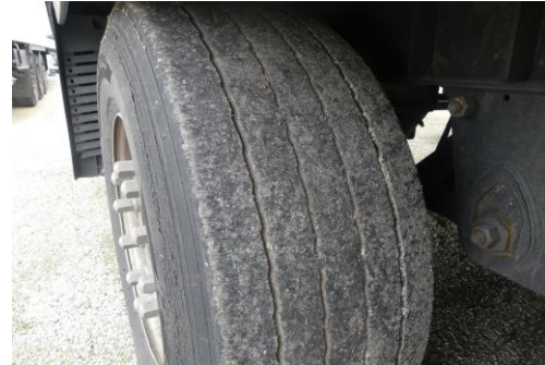
Reifen hinten rechts abgefahren