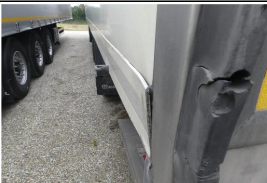
Seitenwand hinten links verformt