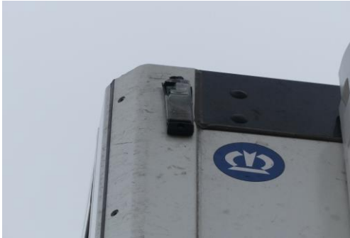
Begrenzungsleuchte vorn rechts gebrochen