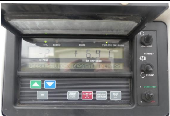
Ansicht Betriebsstunden Kühlaggregat