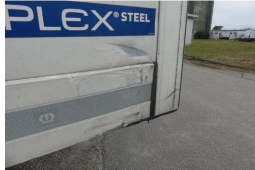
Seitenwand vorn rechts verformt