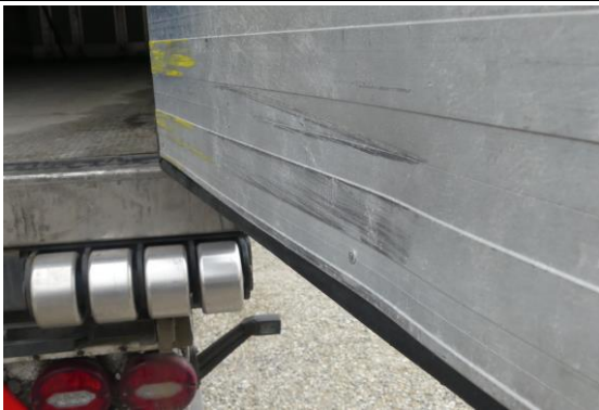
Portaltür hinten innen verformt