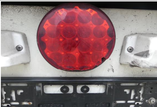
Warnleuchte hinten gebrochen