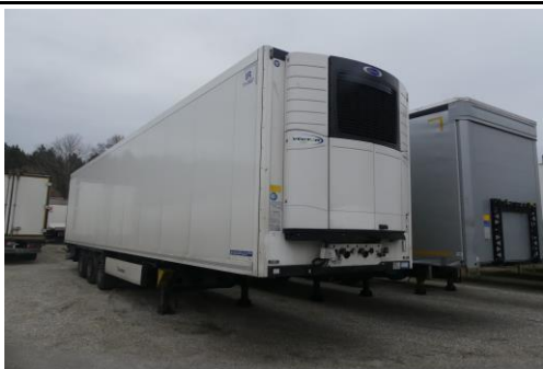
Ansicht vorn rechts