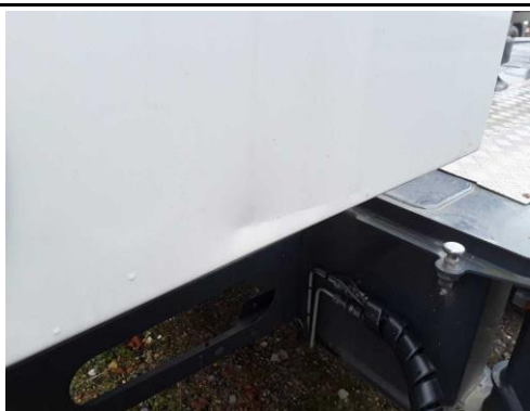
Seitenklappe rechts verformt