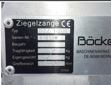
Ansicht Typschild Ziegelzange