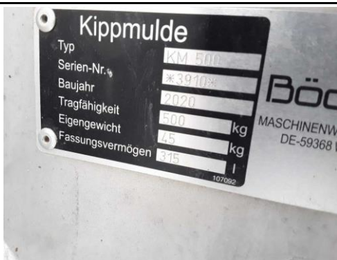
Ansicht Typschild Kippmulde