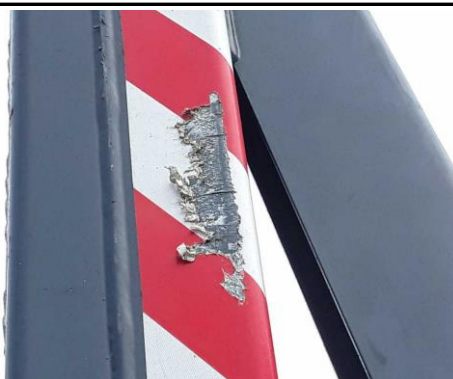
Warnmarkierung Stützfuß beschädigt