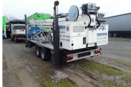
Ansicht hinten links