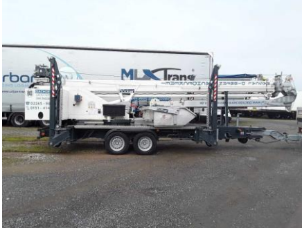
Ansicht Seite rechts