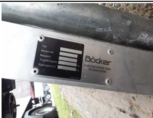
Ansicht Typschild Dachziegelverteiler