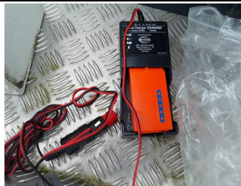
Ansicht Ladegerät Fernbedienung