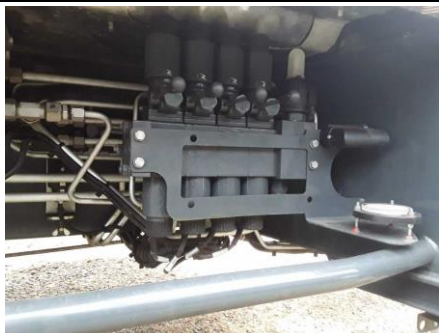
Ansicht Manuelle Bedienung