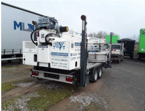
Ansicht hinten rechts