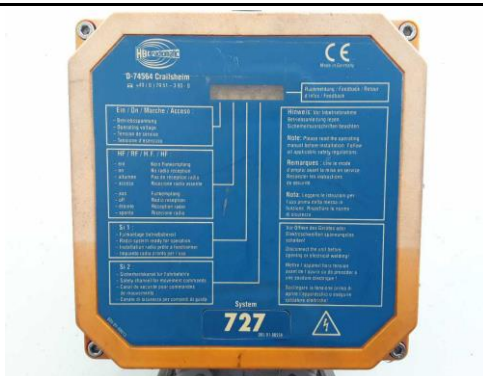
Ansicht Empfänger Fernbedienung