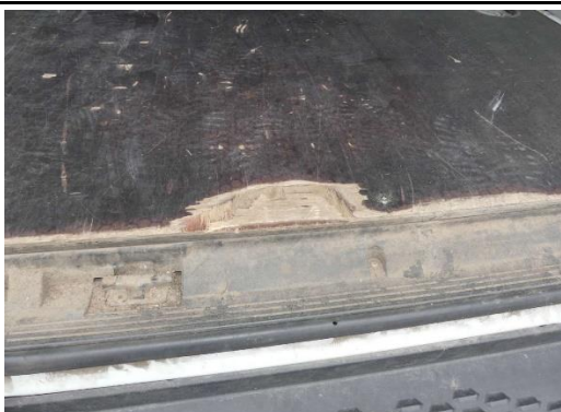
Holzboden Laderaum verschürft, gebrochen