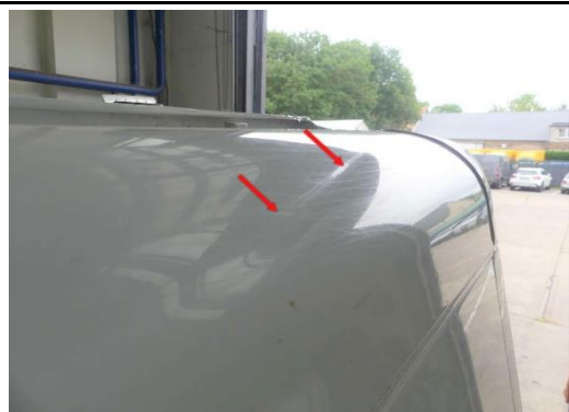
Dachholm hinten links verformt