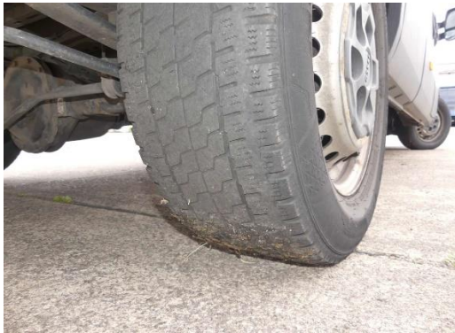
Reifen hinten 2x verschlissen