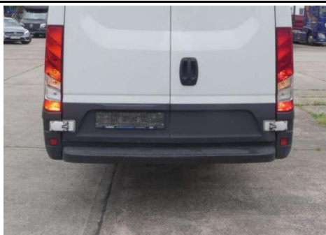
Schriftzüge Hecktüren fehlen