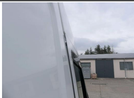
Tür rechts Fehlstellung