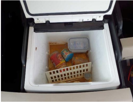
Innenraum stark verschmutzt