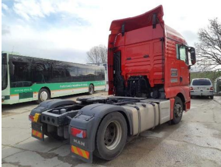
Ansicht hinten rechts