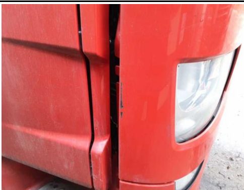
Scheinwerferblende rechts verkratzt