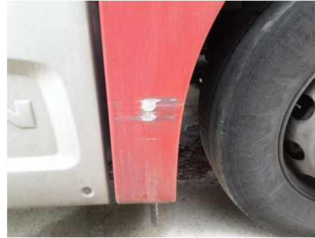
Kotflügel Hinterteil verkratzt/verschürft