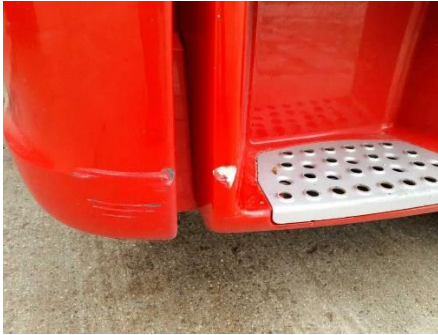
Stoßfängerecke/Einstieg links verkratzt