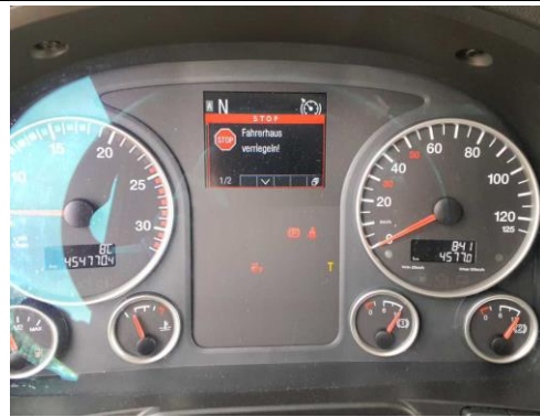
Fahrerhausverriegelung signalisiert Fehlfunktion