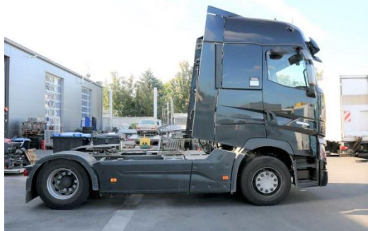
Ansicht Seite rechts