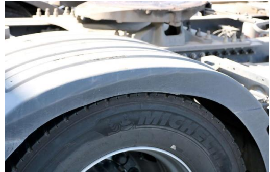
Radabdeckung verformt, verschürft