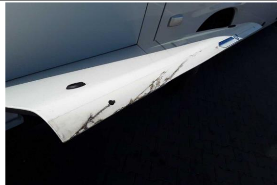
Wartungsklappe vorn links verkratzt