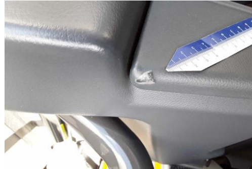
Bezug Armaturenbrett / Verkleidung beschädigt