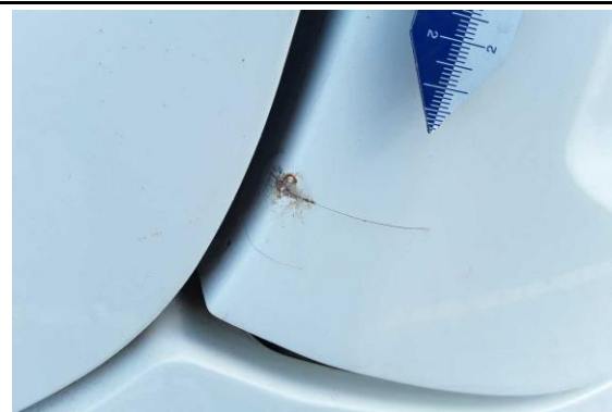
Seitenwand hinten rechts Kratzer / Korrosion