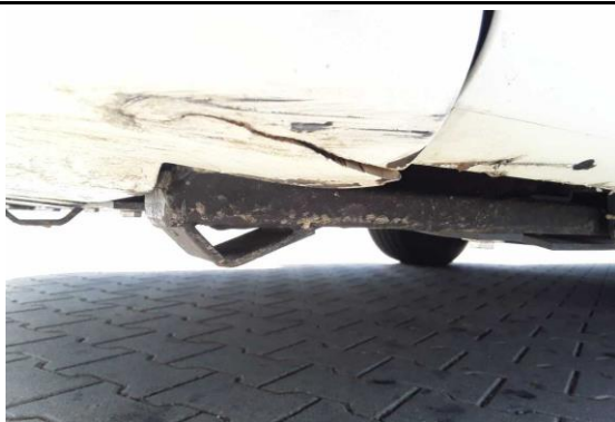
Stoßbecke vorn links gebrochen