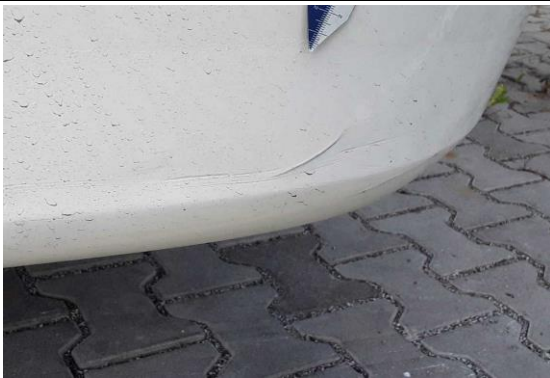
Stoßecke hinten links verschürft