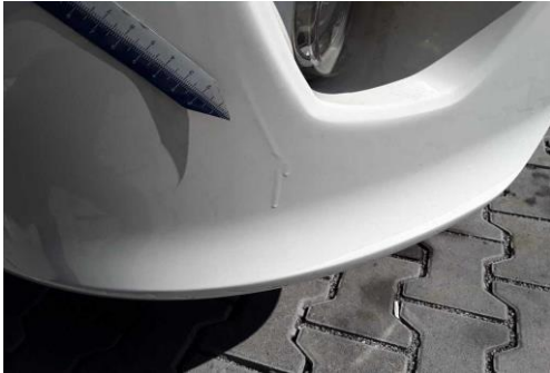
Stoßecke rechts nachlackiert