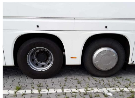
Radblende Antriebsachse fehlt