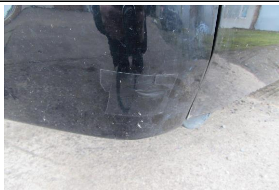
Stoßbecke vorn links gebrochen