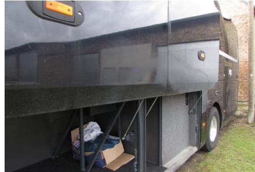
Kofferraumklappen links verformt / verkratzt