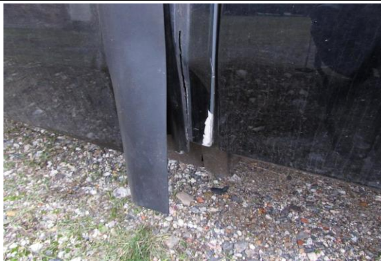
Türgummi Tür mitte gerissen