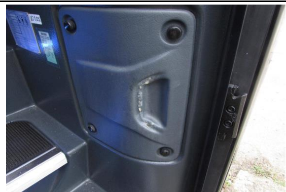
Verkleidung am Einstieg vorn gerissen