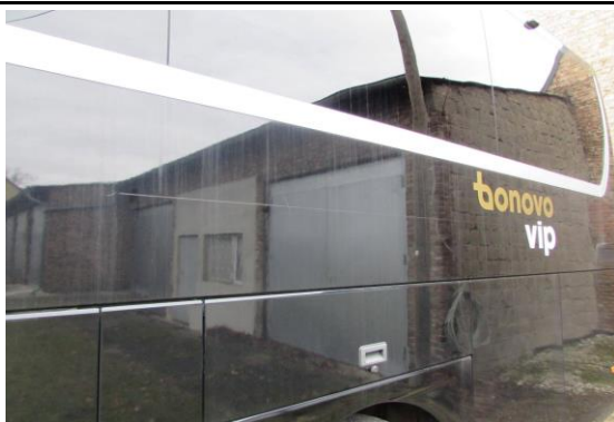
Seitenwand links verkratzt