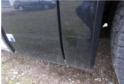
Bepankung und Radlauf vrkratzt